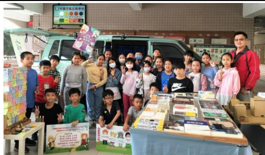
人權教育跨校學習