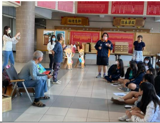
人權教育自由表達意見