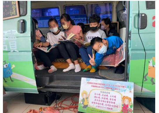
鄰近光華國小學生參觀展覽