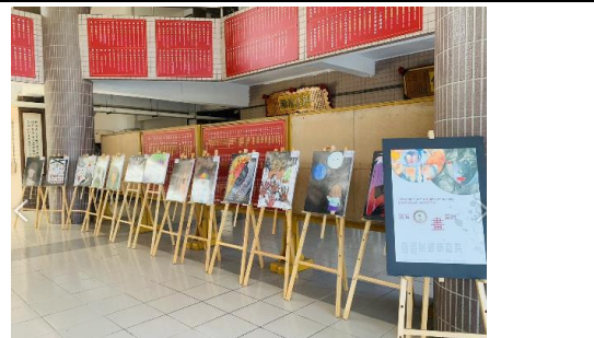
兒童權利公約佈展