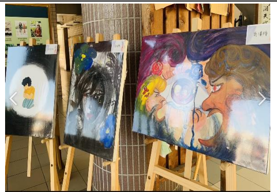
兒童權利公約-學生創作2