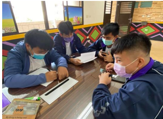
學生為策展形式進行討論