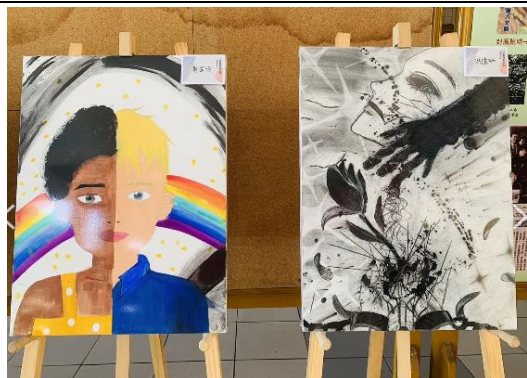
兒童權利公約-學生創作1