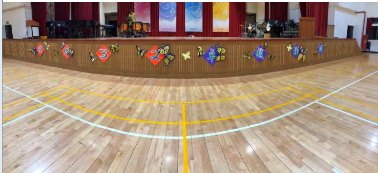
(學生創作成品陳列)