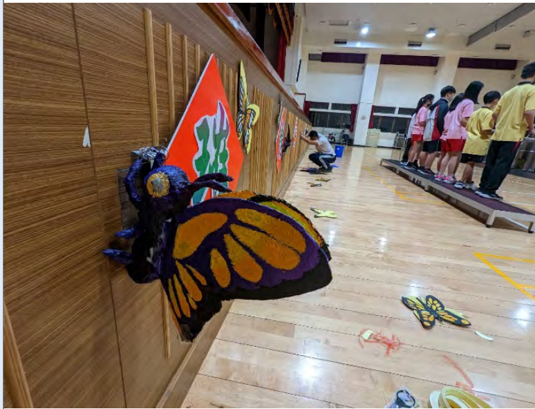
(學生創作成品陳列)