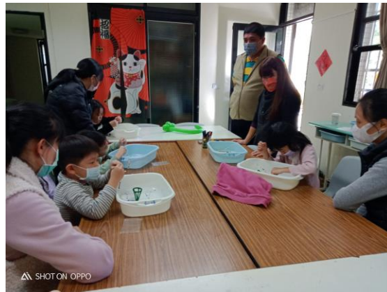
認識織感基礎接觸的應用