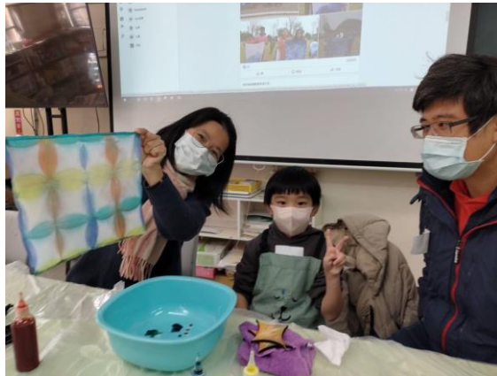
染布的應用與製作成品