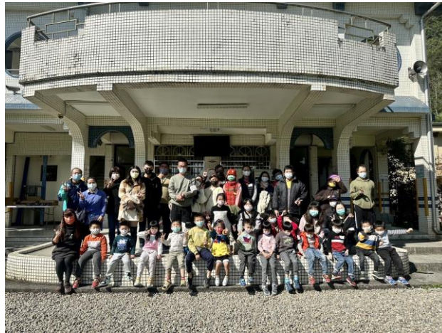
化育美感教育活動體驗團體照