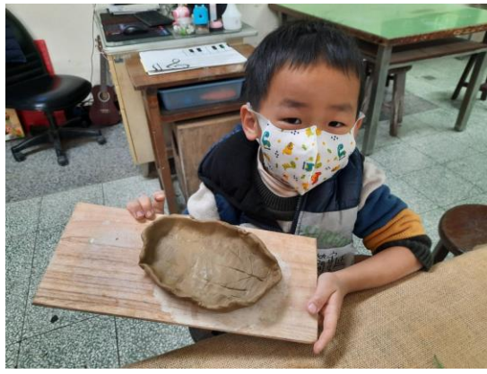
陶土基礎的應用與製作成品