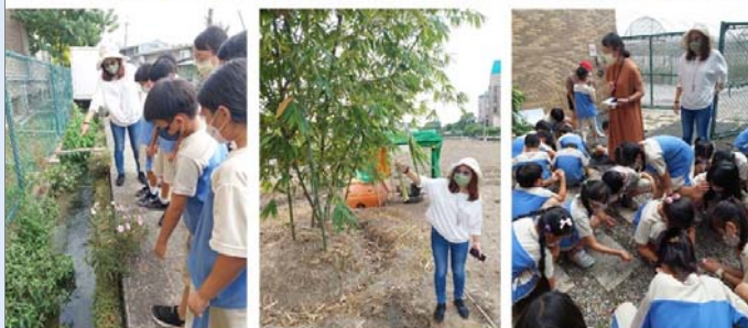
5.田野的閱讀~不想開花的高麗菜