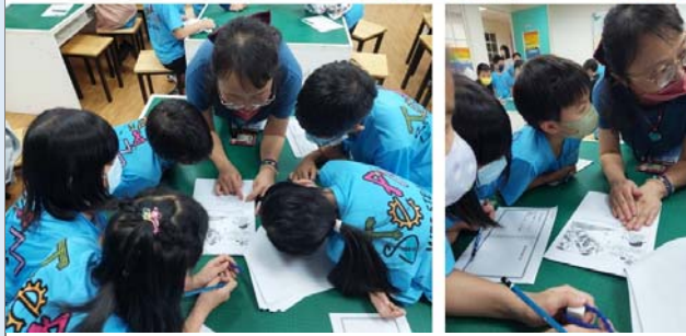
3.花草的悄悄話~花草物語