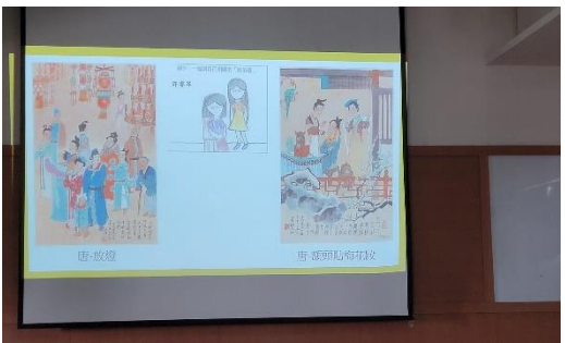
課程說明：透過畫作比一比活動，將學生分享單上的創作與相似主題的「大師畫作」進行比對，找出風俗畫的元素。