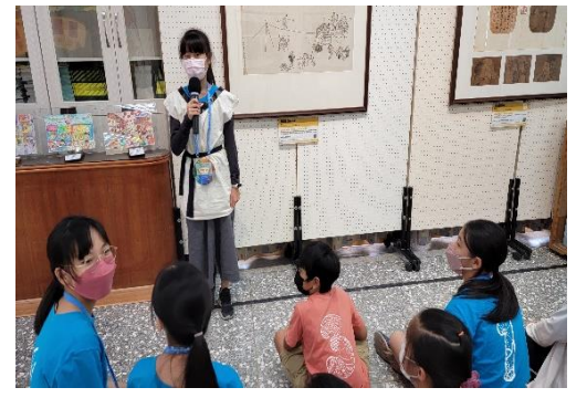
課程說明：展覽開幕活動--導覽畫作服務學習成果發表。