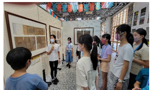
課程說明：同儕觀摩--熟背導覽文稿和儀態與肢體表達練習