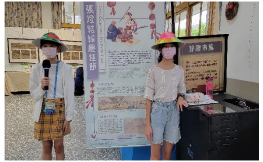
課程說明：展覽開幕活動--導覽畫作服務學習成果發表。