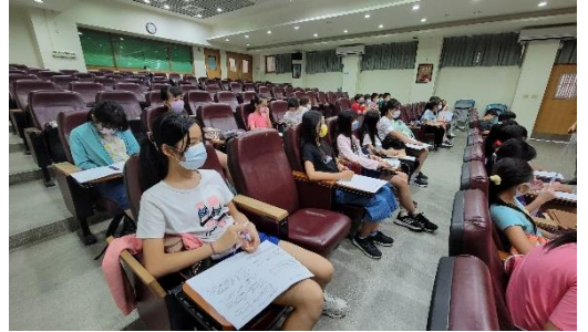
課程說明：從展覽架構和作品賞析，學習導覽稿結構與撰寫技巧