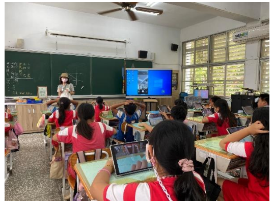
攝影技巧構圖解說