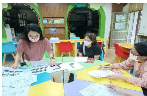
授課教師解說音符