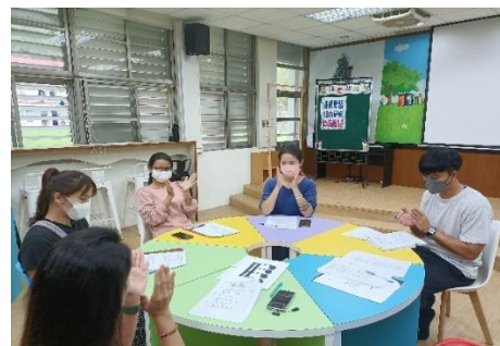
教師群共備練習節奏拍打