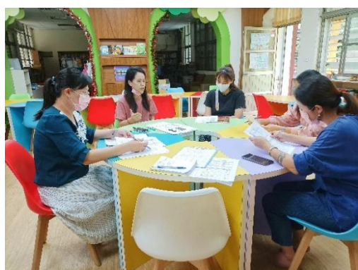
教師群共備討論教案