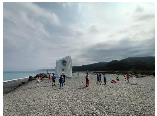
學生練習拍攝攝影