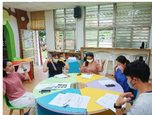
教師群共備討論教案練習節奏