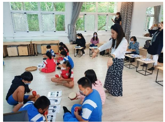
教師教授不同音符的節拍