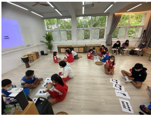
動物好朋友公開課

111.12.23/跨領域美感課程與部分領域雙語教學-動物好朋友公開課/15人/3校