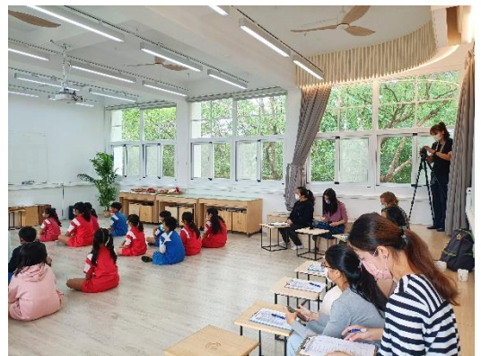
觀課教師參與紀錄觀察