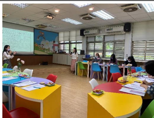
授課教師說明教學理念流程議課討論