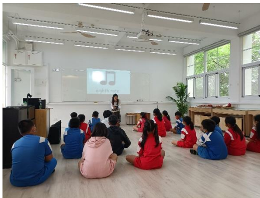
指導學生拍打節奏