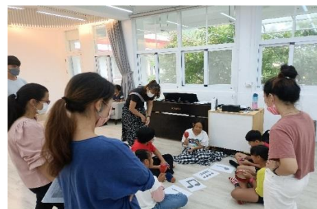
教師群共備討論活動實行