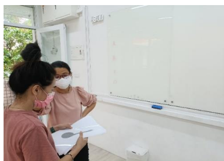
場勘授課地點教具擺放使用