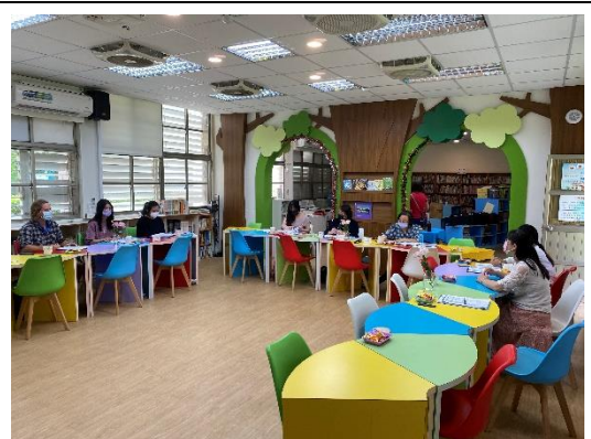
參與議課教師提出建議討論

課中共_____位教師協作，請說明模式：（例：由○○○主教，○○○從旁協助...）