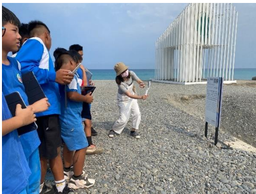
實際練習拍攝攝影