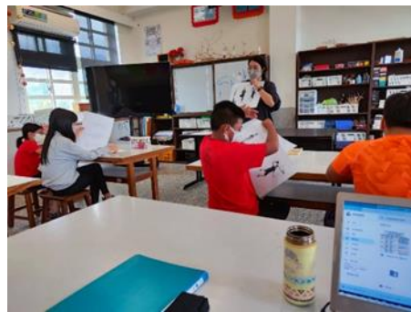
肢體動作課程進行中