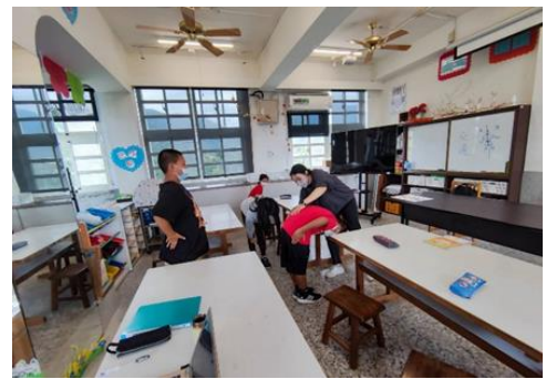
肢體動作課程進行中