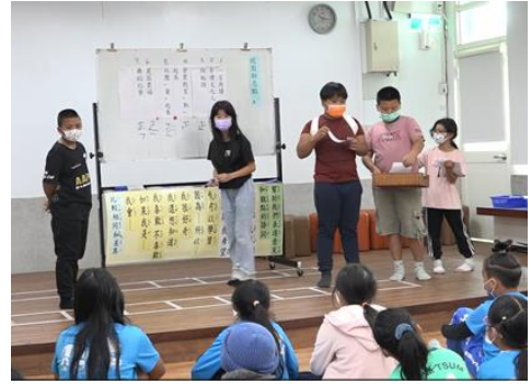
最佳人氣獎票選活動開票中