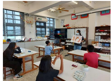
肢體動作動態線作品分享與討論