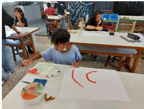
肢體動作動態線練習