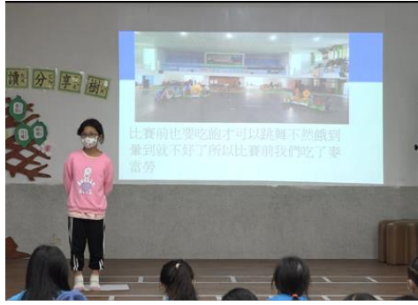
票選活動（政見）發表會