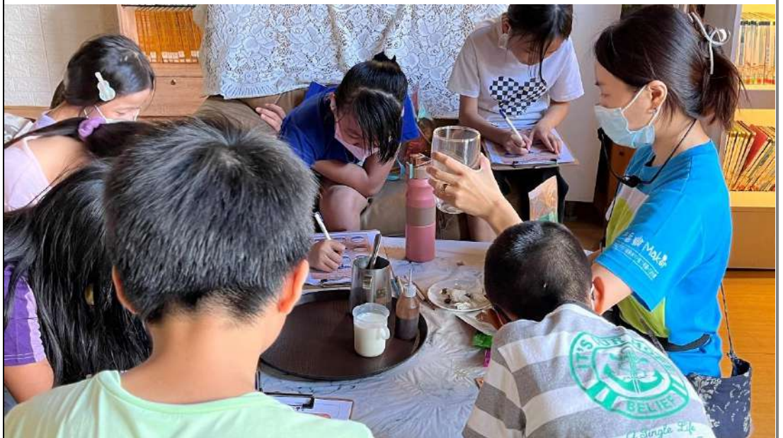
↑ 認識咖啡飲品的種類