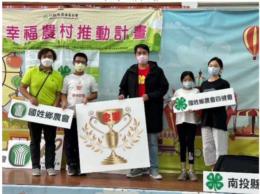
學生得到季軍獎盃