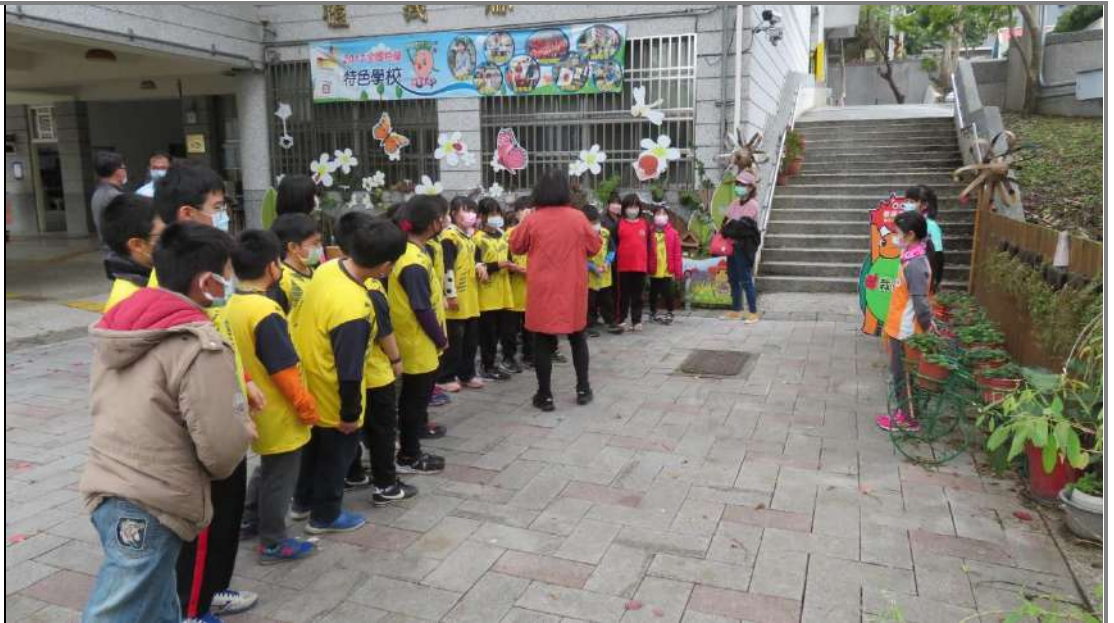
外校來訪時，讓學生親自導覽解說