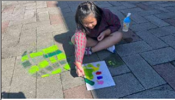
學生使用壓克力顏料將色彩加強