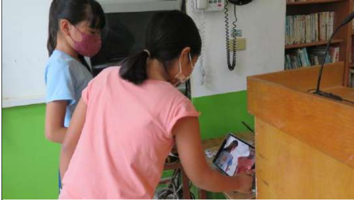
學生將導覽稿內容錄影下來