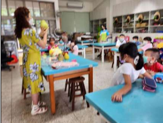
教師向學生講解柚子的生長環境