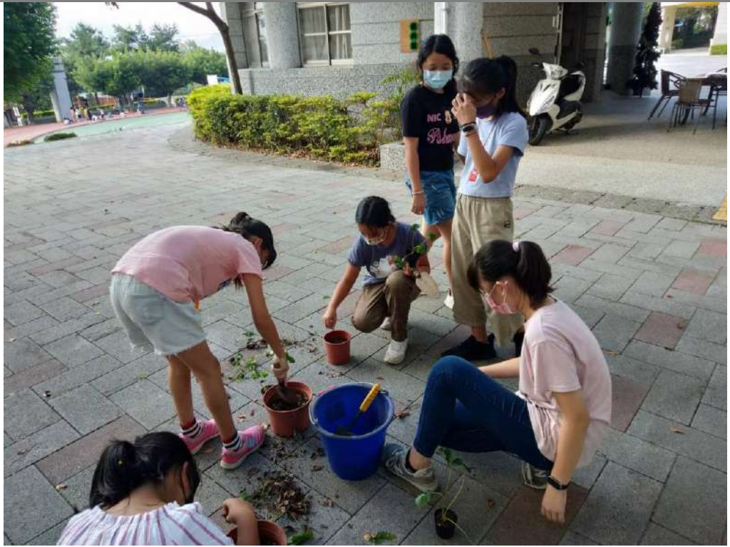
由學生實際操作，並認領後續照顧盆栽。