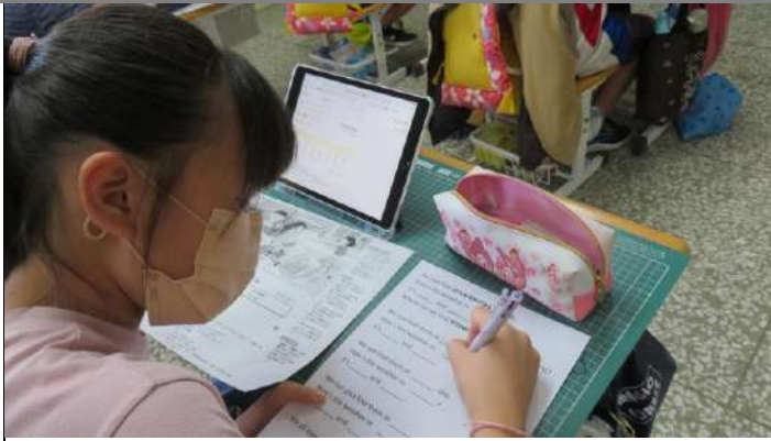
學生將查詢到的天氣記錄下來