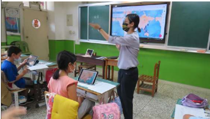
學生使用平板載具在地圖上標出國家位置