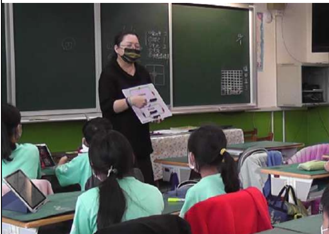
教師進行最後的統整活動

照片至少 6 張加說明，每張 1920*1080 像素以上，並另提供原始 jpg 檔)