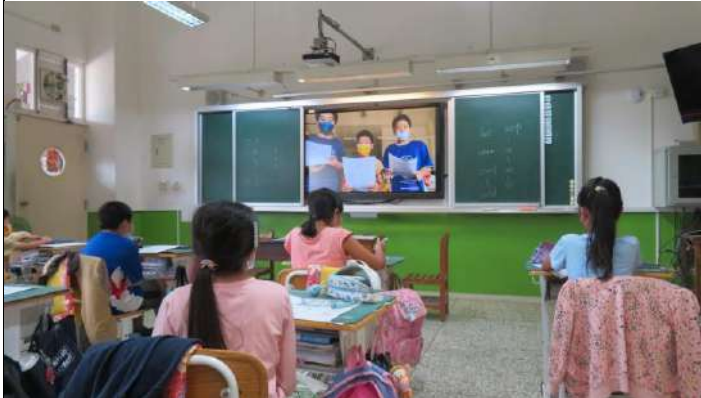
學生共同觀賞錄影成果，並組間互評