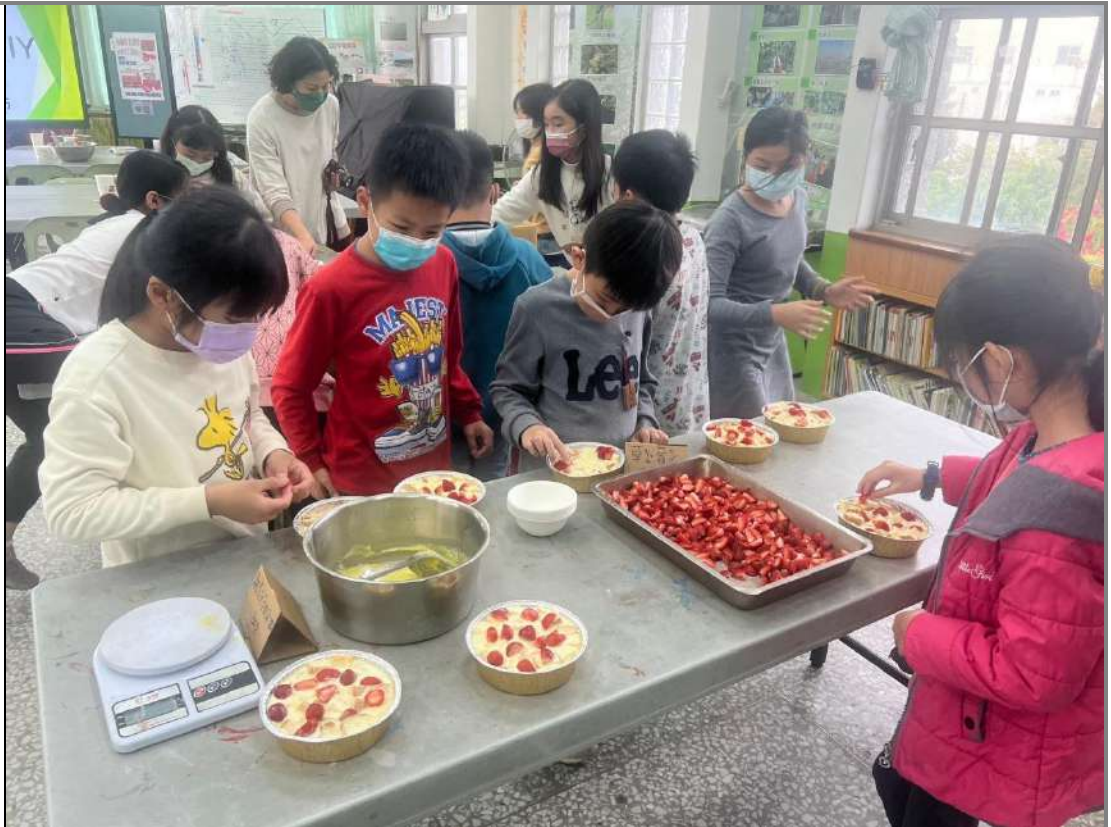
學生使用吐司剩料與過剩的草莓，製作草莓蛋糕