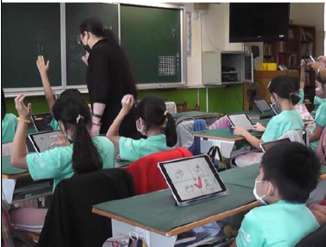
學生在平板上繪製簡易的電池、燈泡串並聯圖