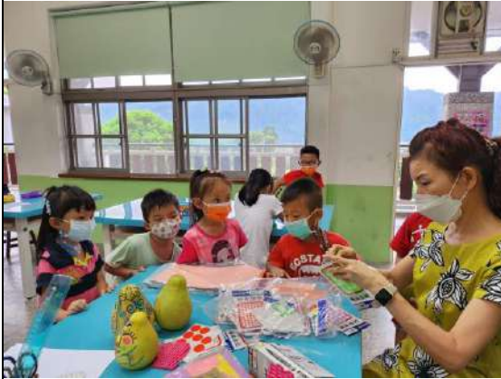
教師指導學生裝飾素材的運用