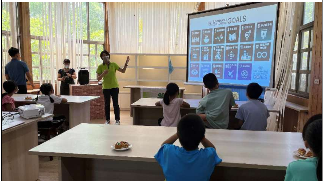
↑ 家鄉產業未來發展與轉型