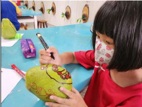
學生使用油漆筆塗上顏色