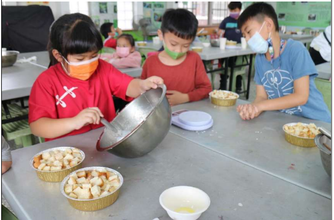
學生使用吐司剩料與過剩的草莓，製作草莓蛋糕