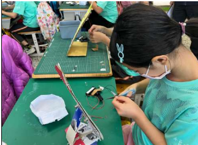
學生自製草莓模板，然後接上電池及燈泡