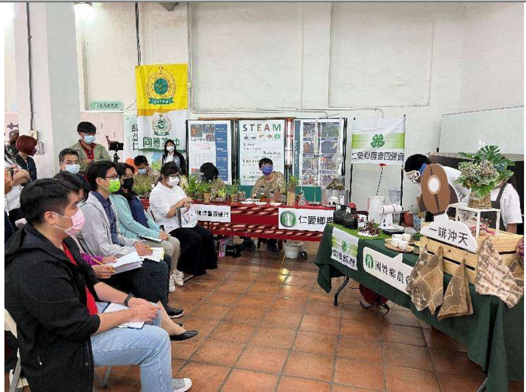
學生參加縣市比賽