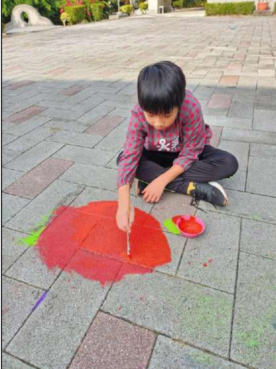
學生加上福龜物產-草莓圖案