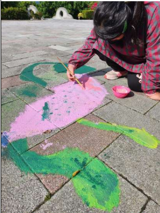
學生彩繪草莓龜妝點校園