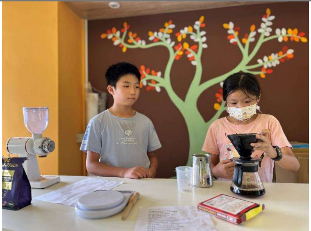
↑學生利用課後時間練習手沖咖啡