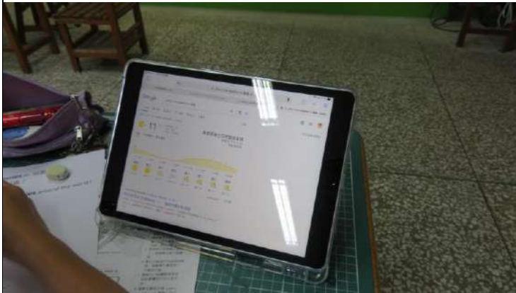
使用平板載具找出各地天氣