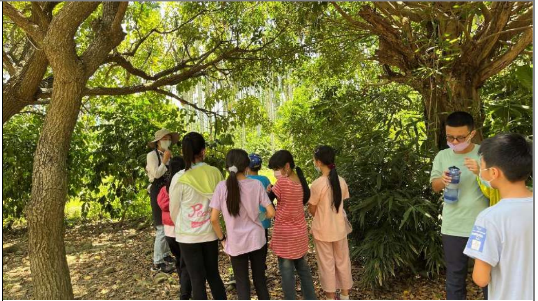
↑ 進入咖啡園區(產地)