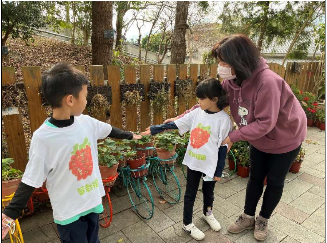
培訓草莓導覽小天使