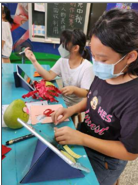
學生使用平板紀錄製作心得