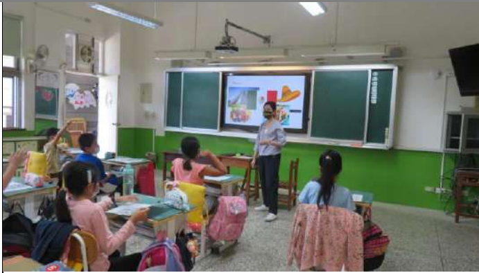
各國草莓環境介紹