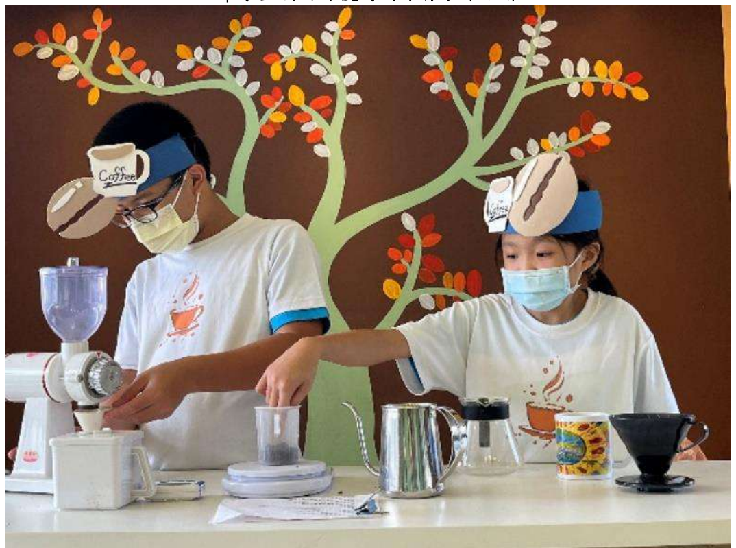
學生著裝正式練習