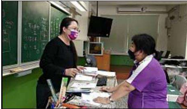
教師與輔導團員進行備課活動