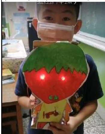
通電後草莓寶寶的眼睛會亮