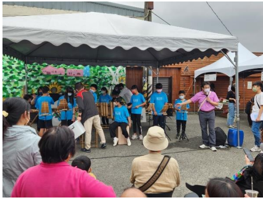
小鎮藝術節校長介紹學校特色竹樂團