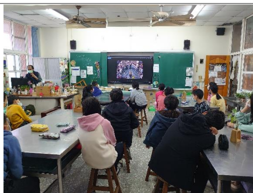
老師上課以 ppt 說明世界各國小鎮藝術節情形