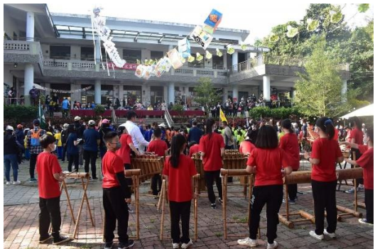
學校特色竹樂團展演於七校聯運