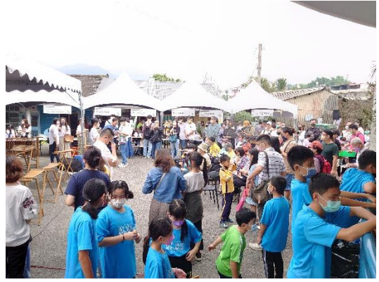
小鎮藝術節現場滿滿參觀人潮