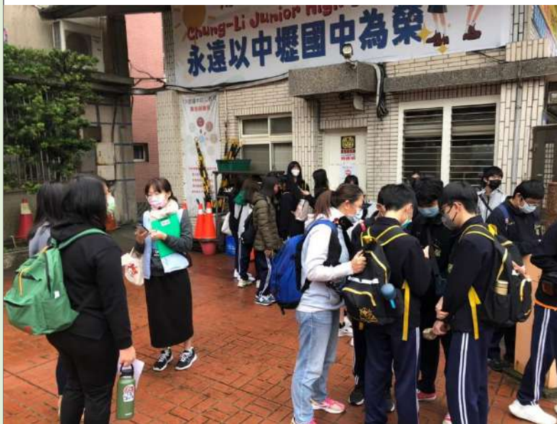
八位教師陪同帶領學生