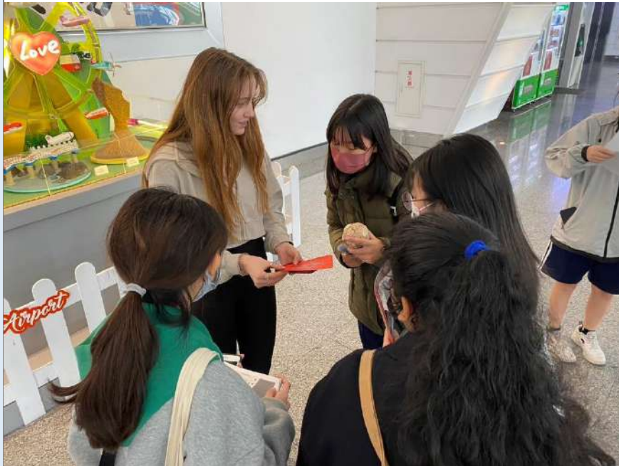
與文創作品致贈交流