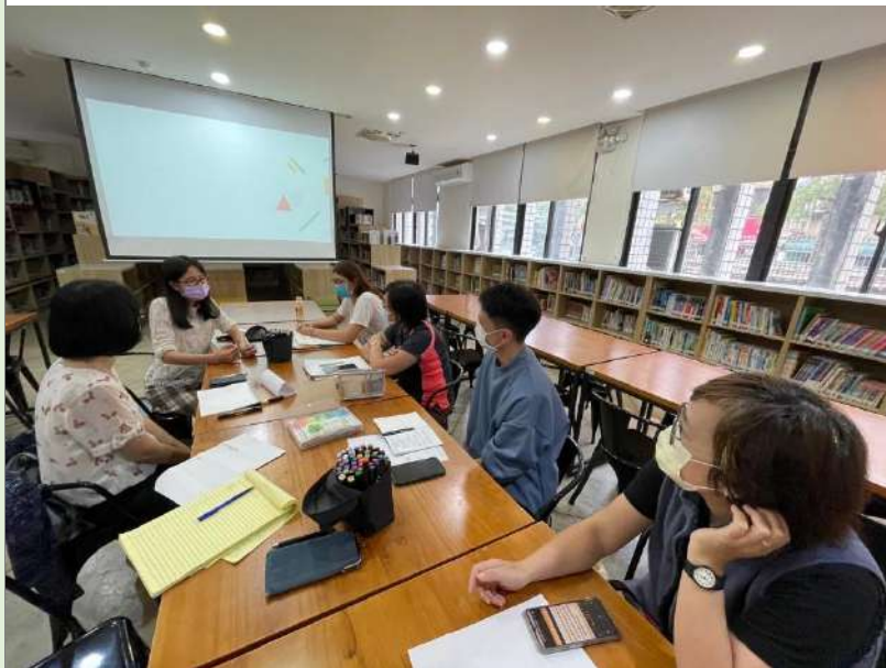
至平鎮國中分享跨領域