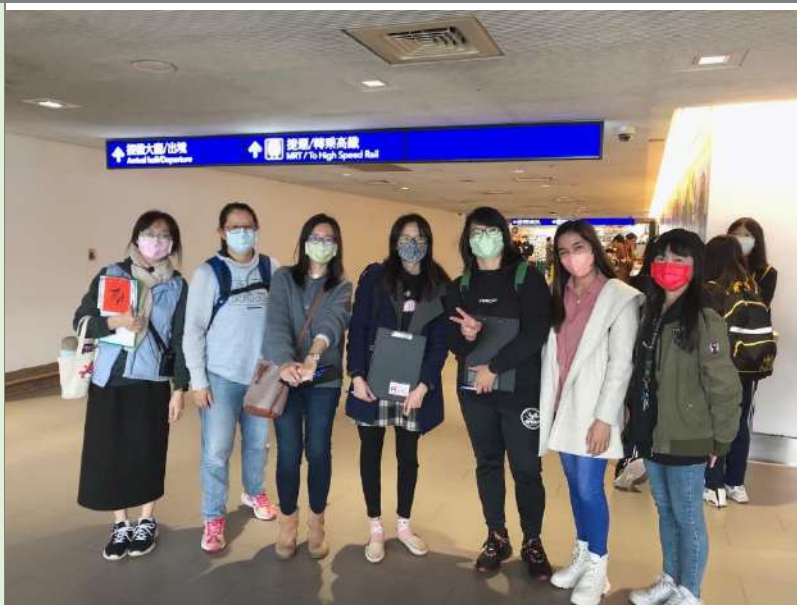
八位教師陪同帶領學生