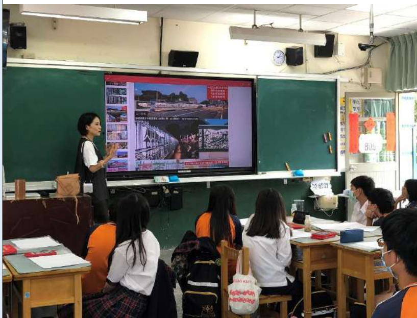
與文化局合作邀請藝術