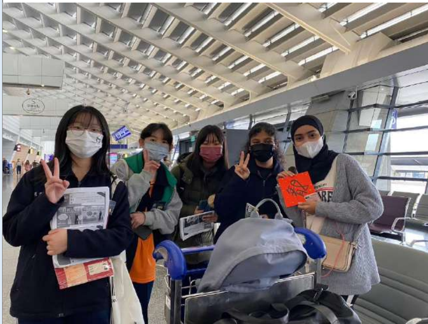
桃園國際機場訪談與