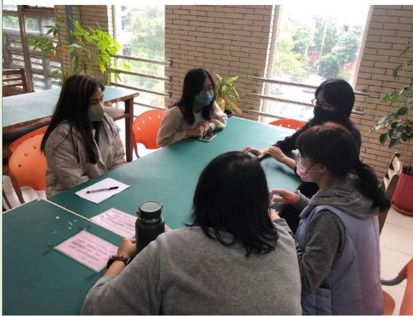
■資源分享 至平鎮國中分享跨領域課程