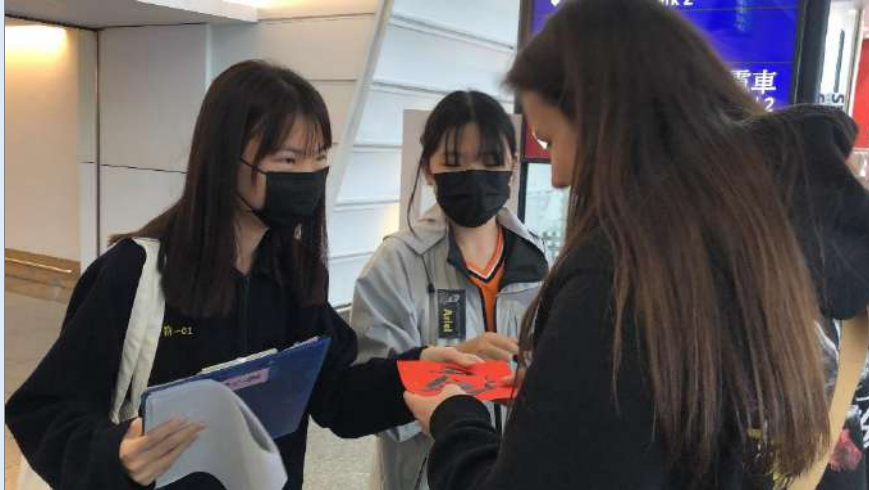
訪談與文創作品致贈交流