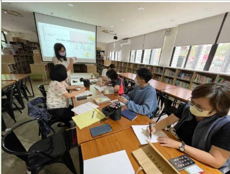
至平鎮國中分享跨領域