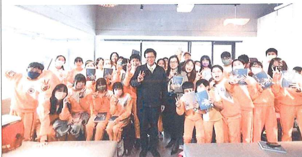
111.12.06/學生實地參與市長新書觀塘、塘觀發表會/27 人/1 校