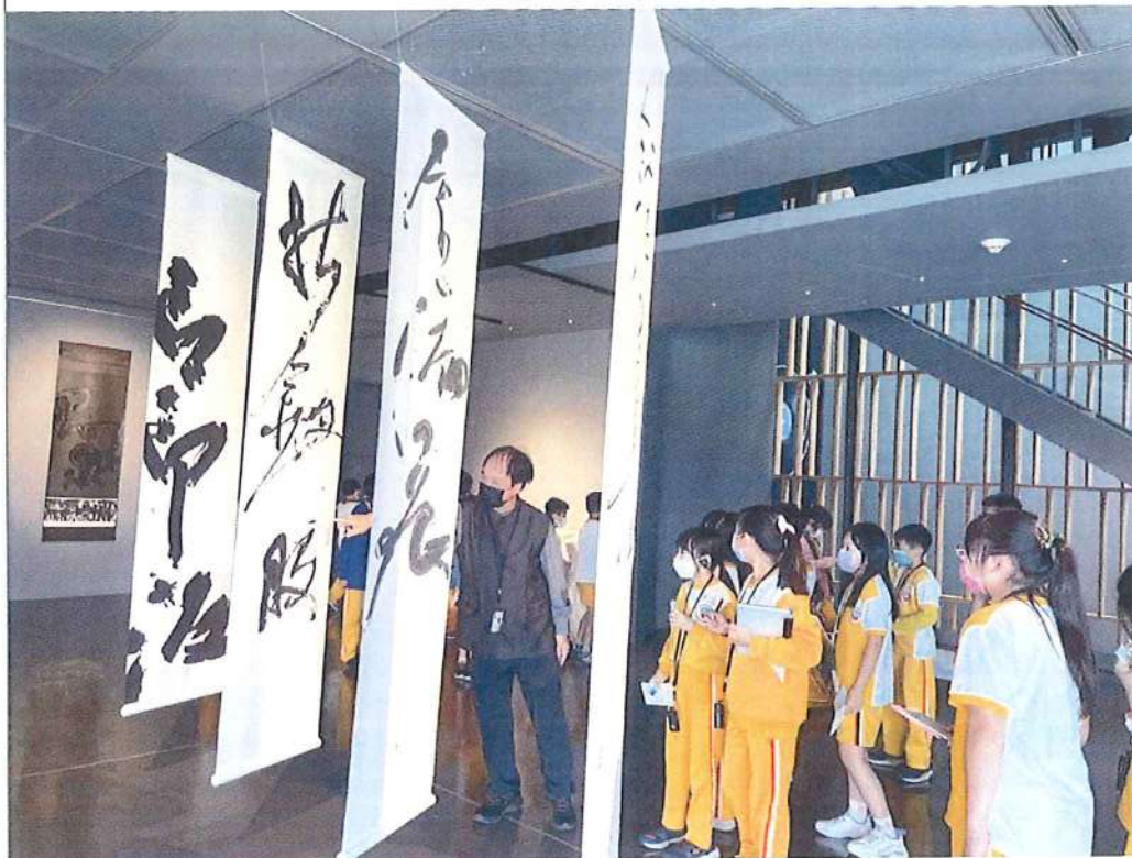
111.11.11/學生實地參訪橫山書法館/27 人/1 校