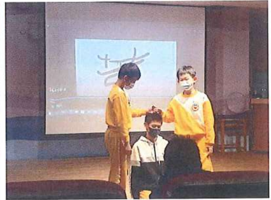
學生定格畫面表演心情與代表字