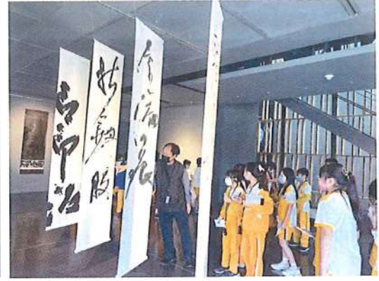
橫山書法藝術館人員介紹傳統書法運筆