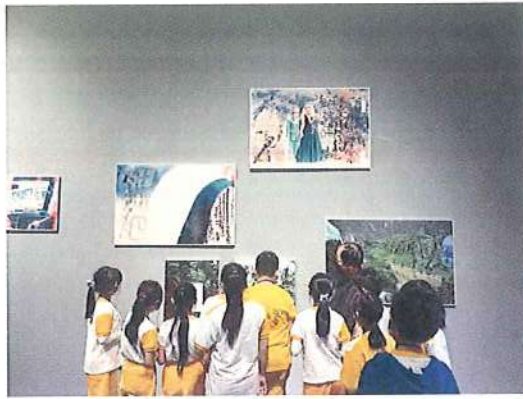
學生參觀橫山書法藝術館聽取導覽