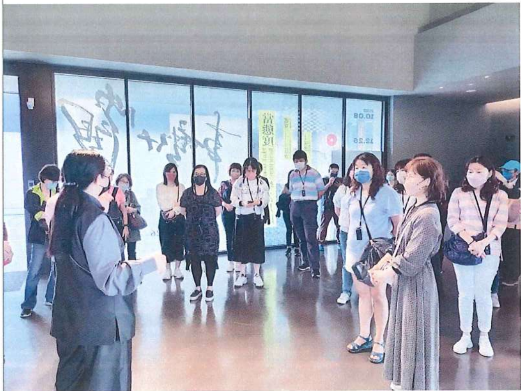
111.11.16/跨領域美感工作坊桃園-教師埤塘美感行旅(參訪橫山書法館)/29 人/1 校