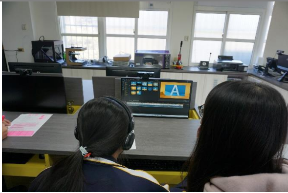
3. 綠幕去背換背景教學