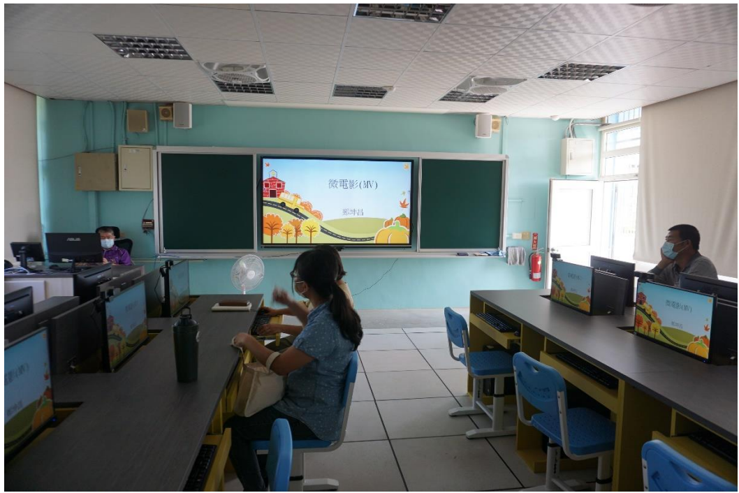
說明：如何把想法轉變成劇本