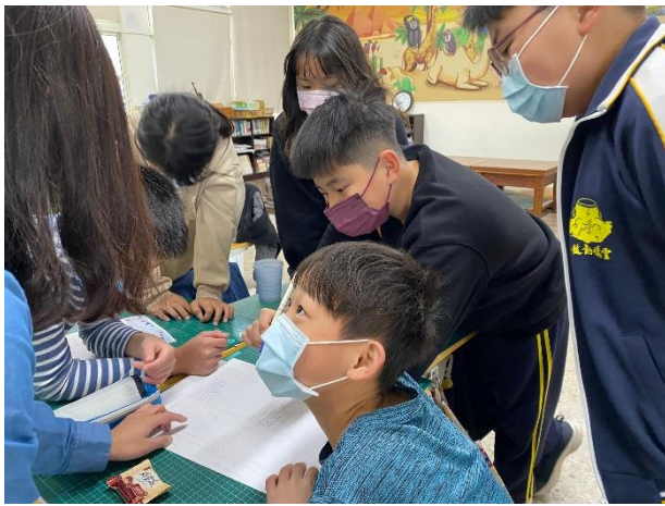
3. 分鐘表學習分組創作