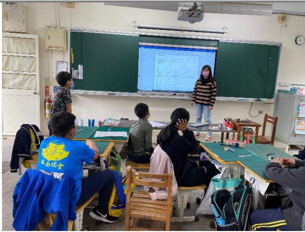
2. 分鏡表學習單說明