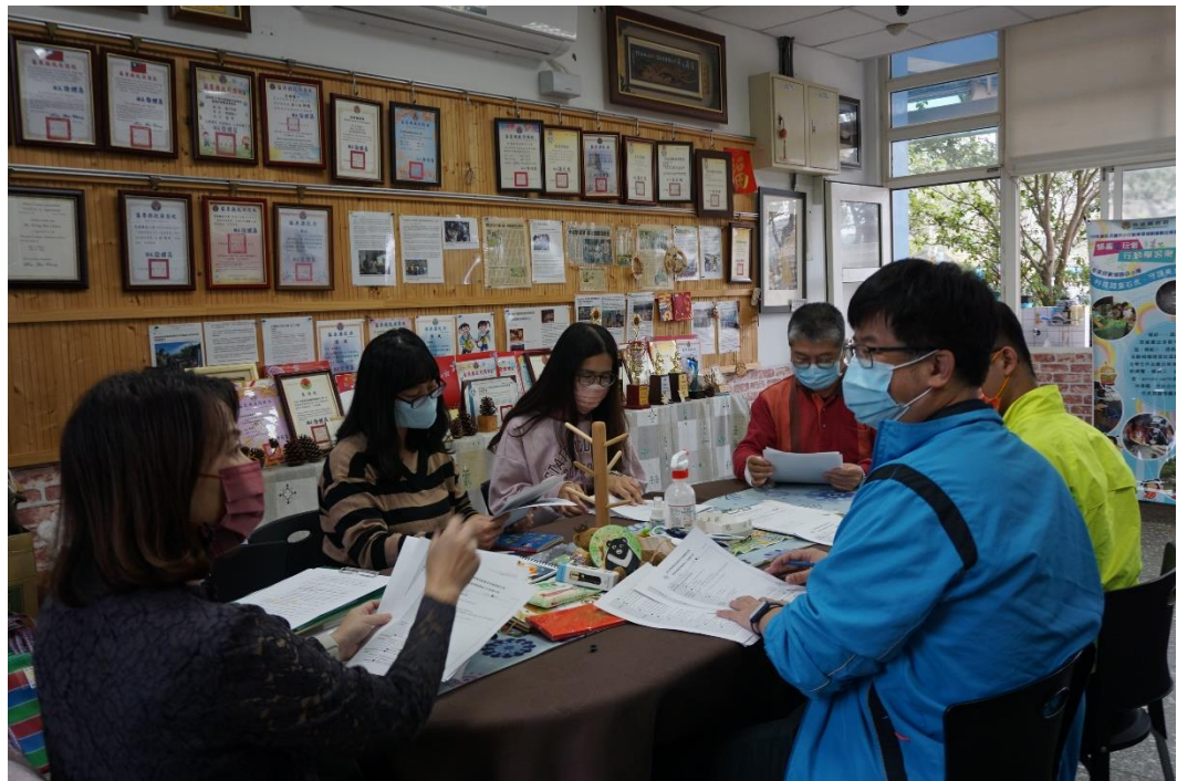
教案內容討論與課程分工