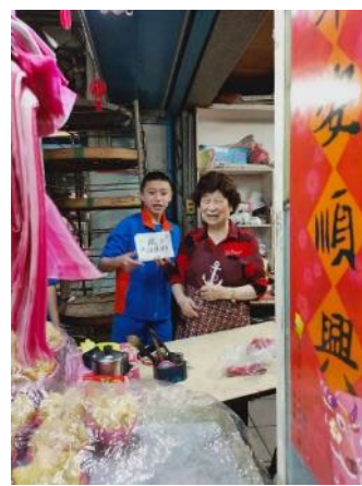
跟糕餅店奶奶合照