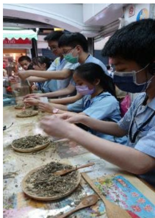
市場走讀—805 LOGO 合作店家—大明中藥行青草店 防蚊草藥包 DIY