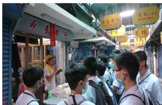
市場走讀—805 LOGO 合作店家—源春布行