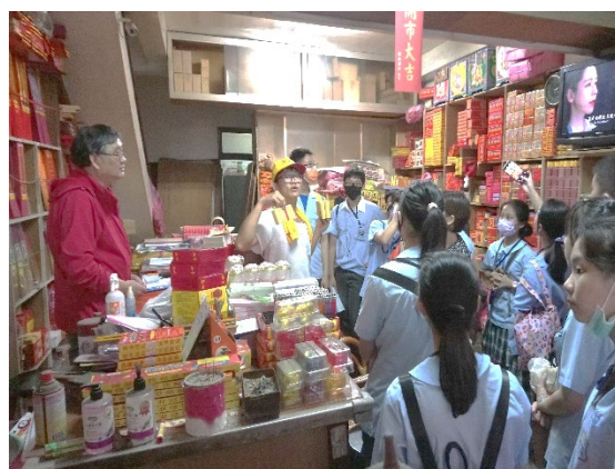
市場走讀—805 LOGO 合作店家—全成金香店 介紹中衣用途，比較台北澎湖及宜蘭中衣不同大小及項目，想想看為什麼不同？