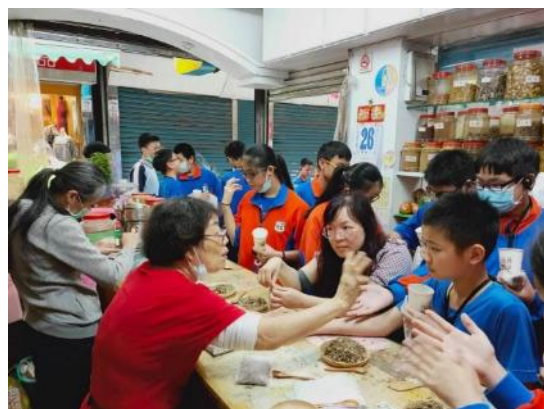
市場走讀—808 LOGO 合作店家—大明中藥行青草店 魔法阿嬤會幫你看手相，告訴孩子注意身體及心理的問題好驚奇