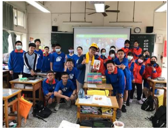
方子維老師致贈書籍給母校