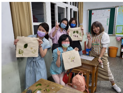
運用校園植物規劃設計美感小物。