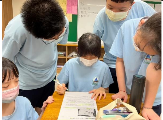
學生以小組方式進行數位性暴力的區選。