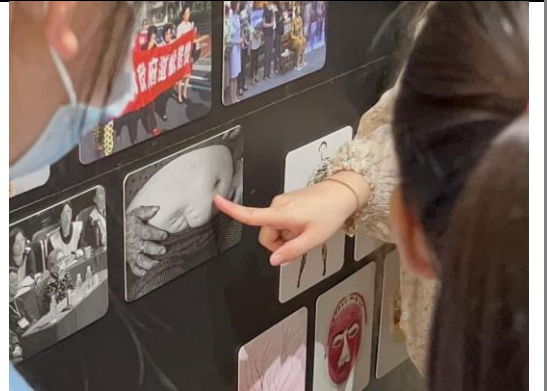
運用阿嬤之家的資源與圖卡 學生看到相關資料很驚訝!!