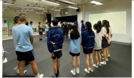
表演藝術公開授課的課程部分