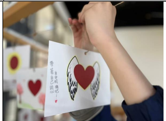
將完成的藝術作品懸掛校園之中，達到 倡議與發聲行動。