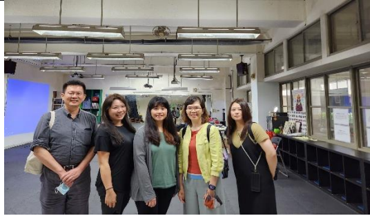
國家教育研究院三位研究員參與公開授課，給予課間觀察與課後滿滿回饋