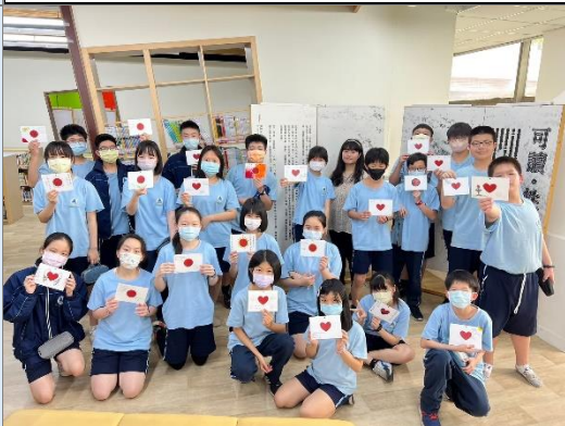
學生完成的一人一心創作