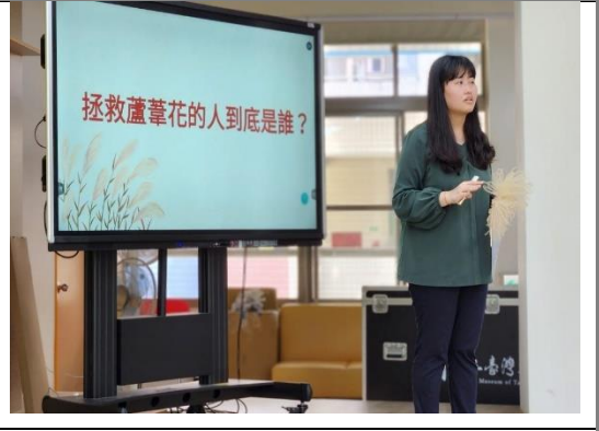
閱讀教育融入議題教學。