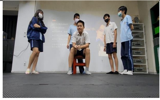
學生以岡本為中心，角色扮演提問