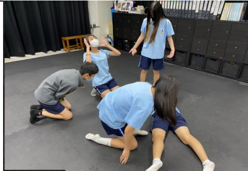
學生在小組中即興練習-口說默劇