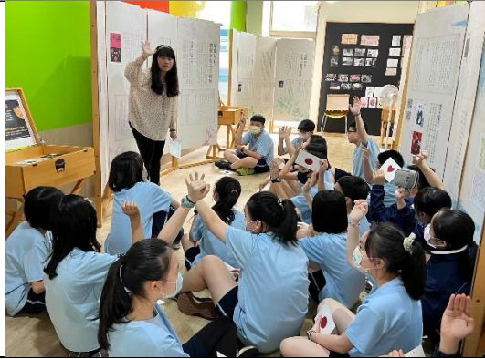
閱推教師運用國家文學館的展覽資源，豐厚學生對慰安婦的認識。