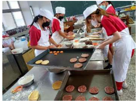
特色手工餅乾製作