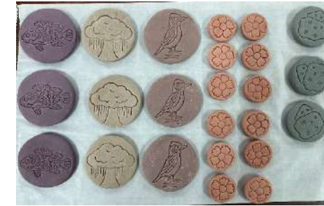
餅乾手工皂半成品