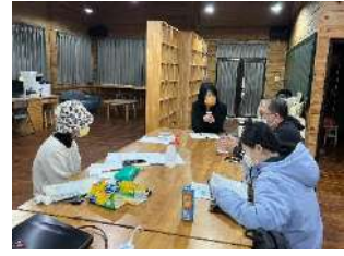
112/03/13 小組工作坊/課程討論會議