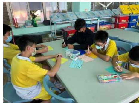
國際交流---日本兵庫縣 寶塚市 中山五月台中學