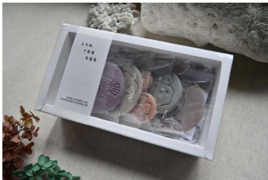
餅乾手工皂成品—禮盒