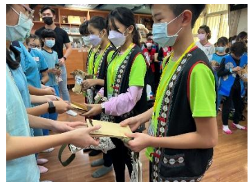
大王國小學生到台北南門國小參訪及參訪南門校本課程-植物園