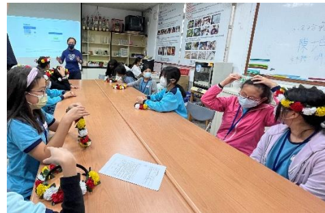
耆老介紹部落及內部的歷史故事及典故