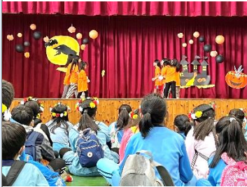
大王國小進行迎賓舞表演