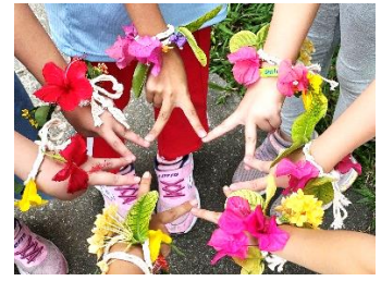
排灣族花環:學習及製作，學習花環頭飾及手飾製作。