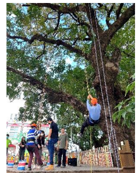
學習攀樹，透過攀樹課程繩索安全地攀爬，由大王學生協助南國國小學生穿戴安全攀樹器材和護具，在教師引導下小組進行攀爬體驗。