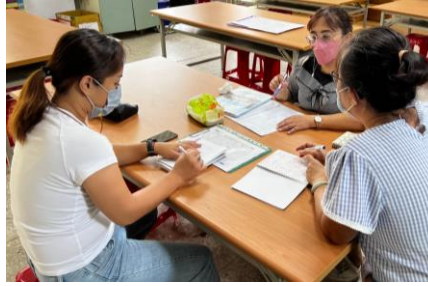
校內外教師共備討論