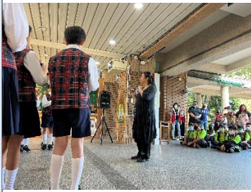
南門國小學生表演迎賓樂曲