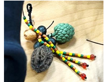
為南門國小學生戴上花環及配戴手環，製作在地的釋迦吊飾和代表排灣族的黃，澄，綠色彩