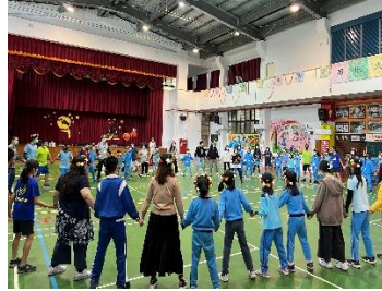
兩校學生進行排灣族的舞蹈