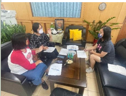
小書內容、排版、封面等說明及討論