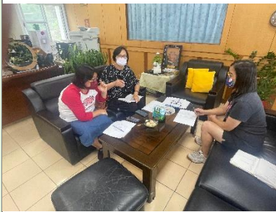
小書內容、排版、封面等說明及討論