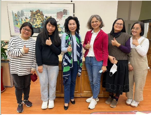
結束後與郭美女教授合影