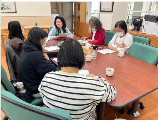
與郭美女教授討論課程架構及內容