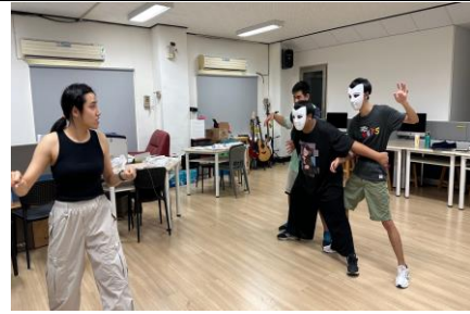
肢體表達與音樂融合