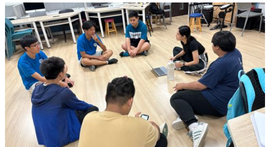
肢體語言如何表達抽象的音樂情感