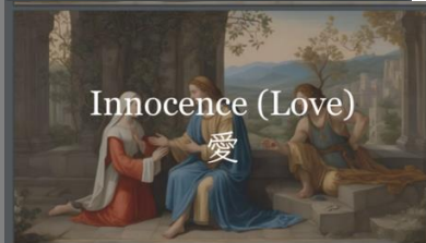
Innocence (Love) 愛