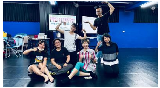
微雙語說各式劇場跨校表演藝術教師增能