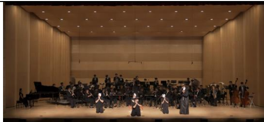
日昇東中 夏日傳奇音樂會