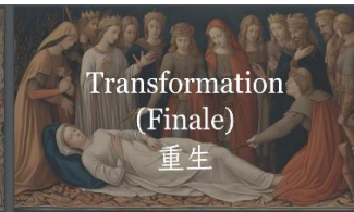
Transformation (Finale) 重生