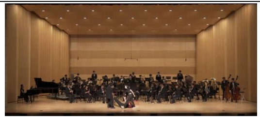
日昇東中 夏日傳奇音樂會