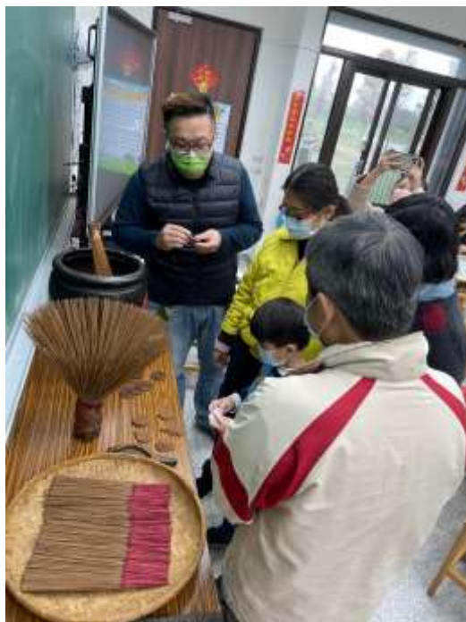
112.2.18 跨領域美感工作坊/10 人/2 校