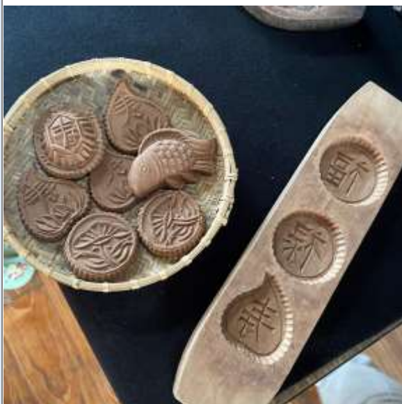
圖說：製作香牌的模具與圖騰