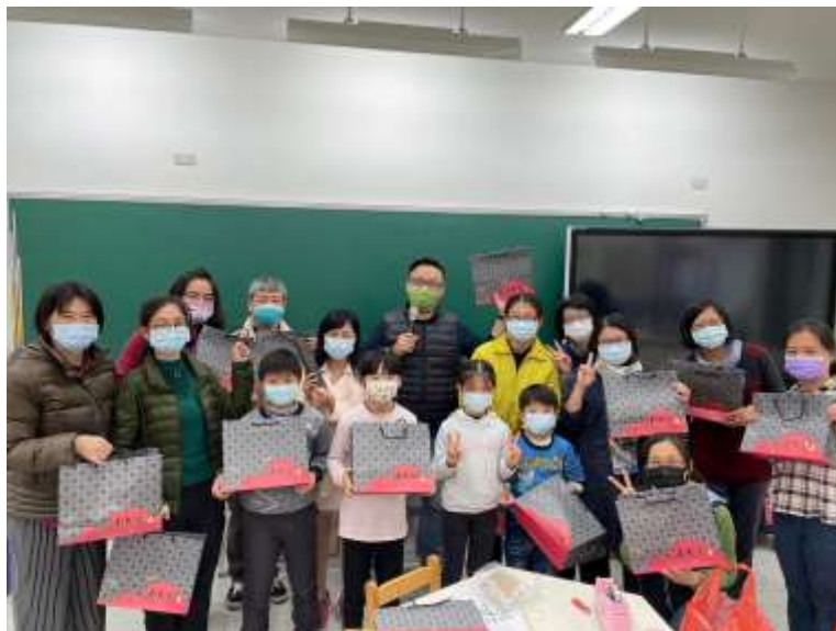
112.2.18/線香手作教師課程共備/10 人/2校