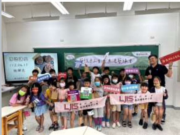
圖說：認識傳統線香工藝講座。

(照片至少 6 張加說明，每張 1920*1080 像素以上，並另提供原始 jpg 檔)