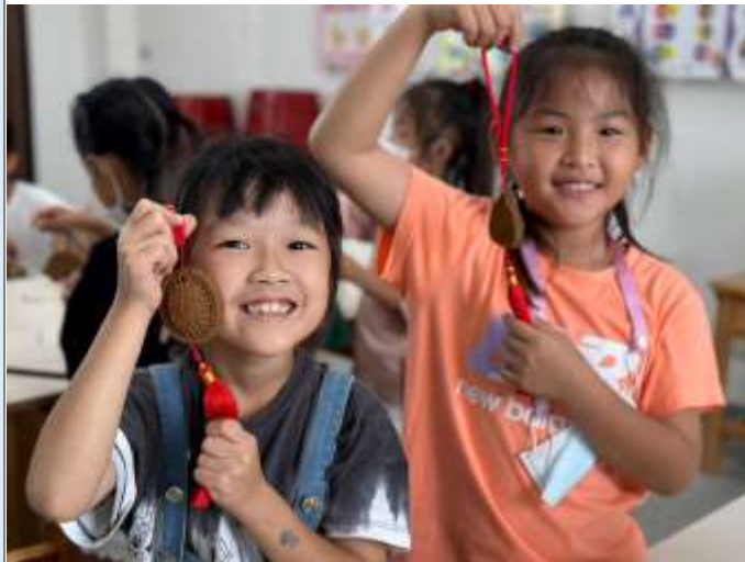
圖說：學生香牌成果