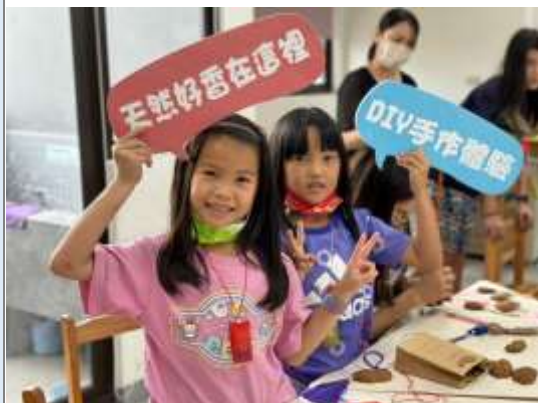
圖說：學生實作體驗活動