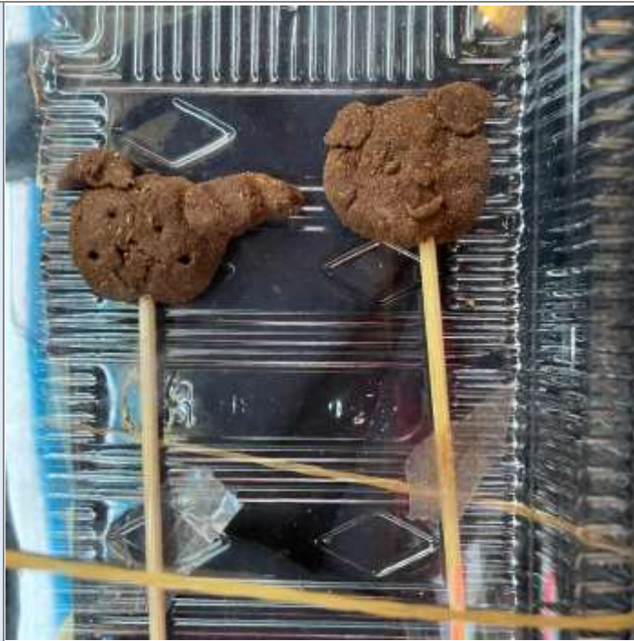
圖說：學生創意作品～線香捏麵人