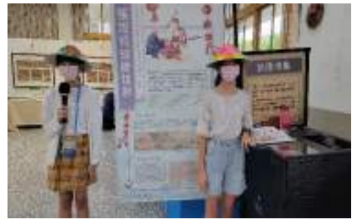
課程說明：展覽開幕活動--導覽畫作服務學習成果發表。