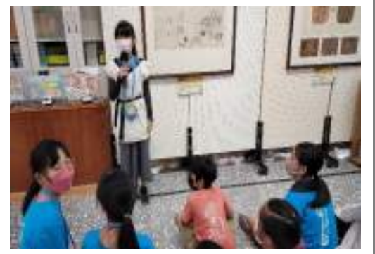
課程說明：展覽開幕活動--導覽畫作服務學習成果發表。