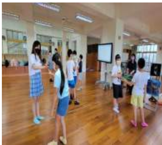
課程說明：兩人一組進行關注力訓練