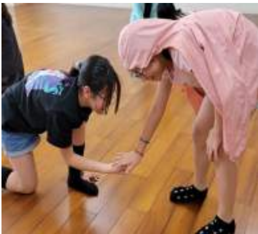
課程說明：兩人一組節奏模仿卡農。