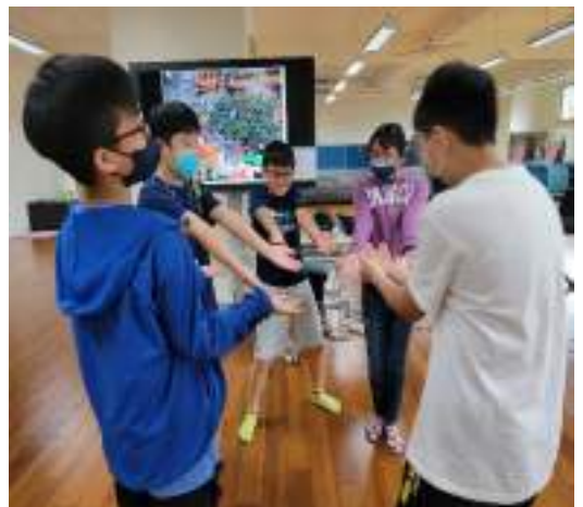
課程說明：分組進行創編作品發表。