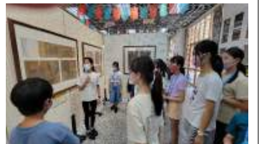
課程說明：同儕觀摩--熟背導覽文稿和儀態與肢體表達練習