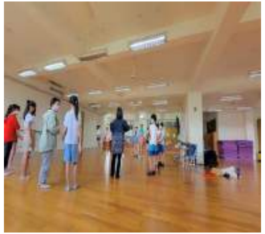
課程說明：模擬劇場舞台進入與離開。