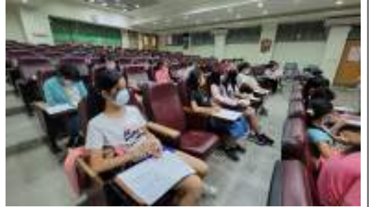
課程說明：從展覽架構和作品賞析，學習導覽稿結構與撰寫技巧