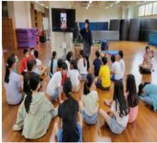
課程說明：介紹模擬手機鈴聲動作影片