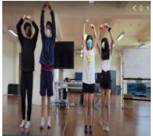
課程說明：分組創編手機鈴聲動作