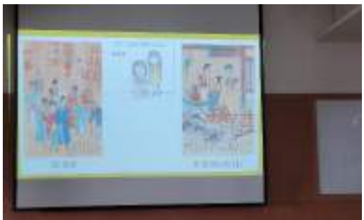
課程說明：透過畫作比一比活動，將學生分享單上的創作與相似主題的「大師畫作」進行比對，找出風俗畫的元素。