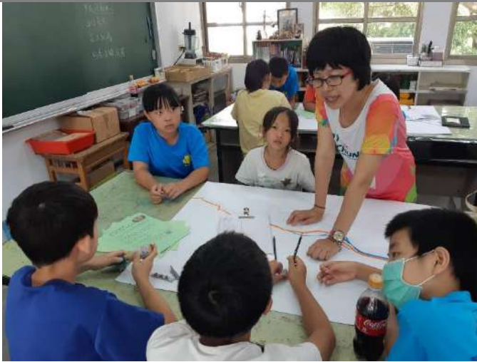
3. 使用顏色區隔道路及水路