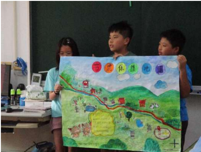
三、綜合活動 地圖解說訓練。