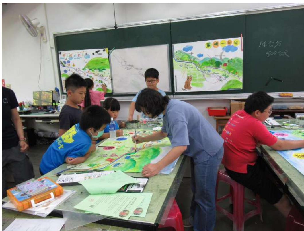
老師指導學生上色技巧