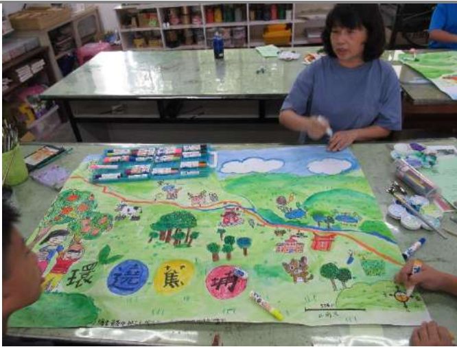
8. 撰寫解說語與成品完成