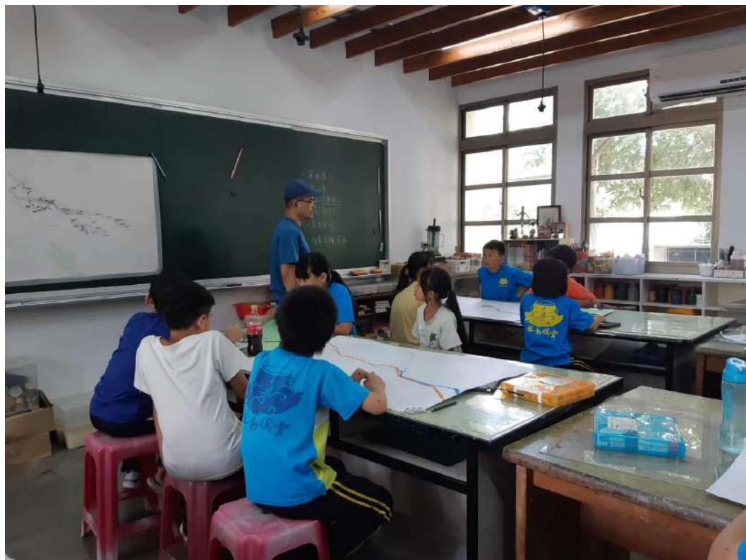
老師說明導覽地圖繪製的要素