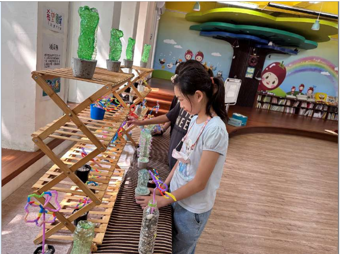
說明：學生進行佈展。