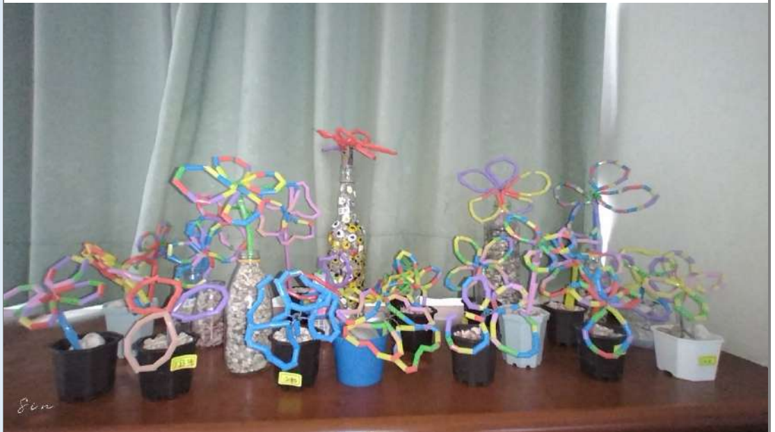
說明：完成吸管花作品。