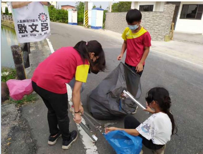
說明：學生到社區進行淨村活動情形。