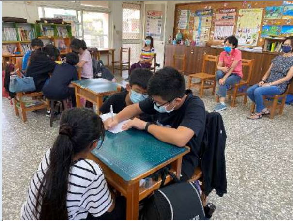
說明：學生針對所發現之社區問題，由老師彙整，在課堂上相互討論並發表解決的辦法。