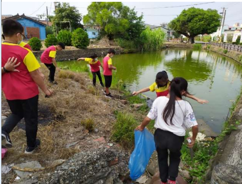
說明：學生到社區進行淨村活動情形。