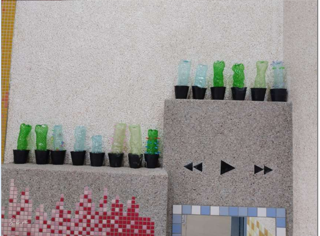
說明：完成寶特瓶仙人掌作品。