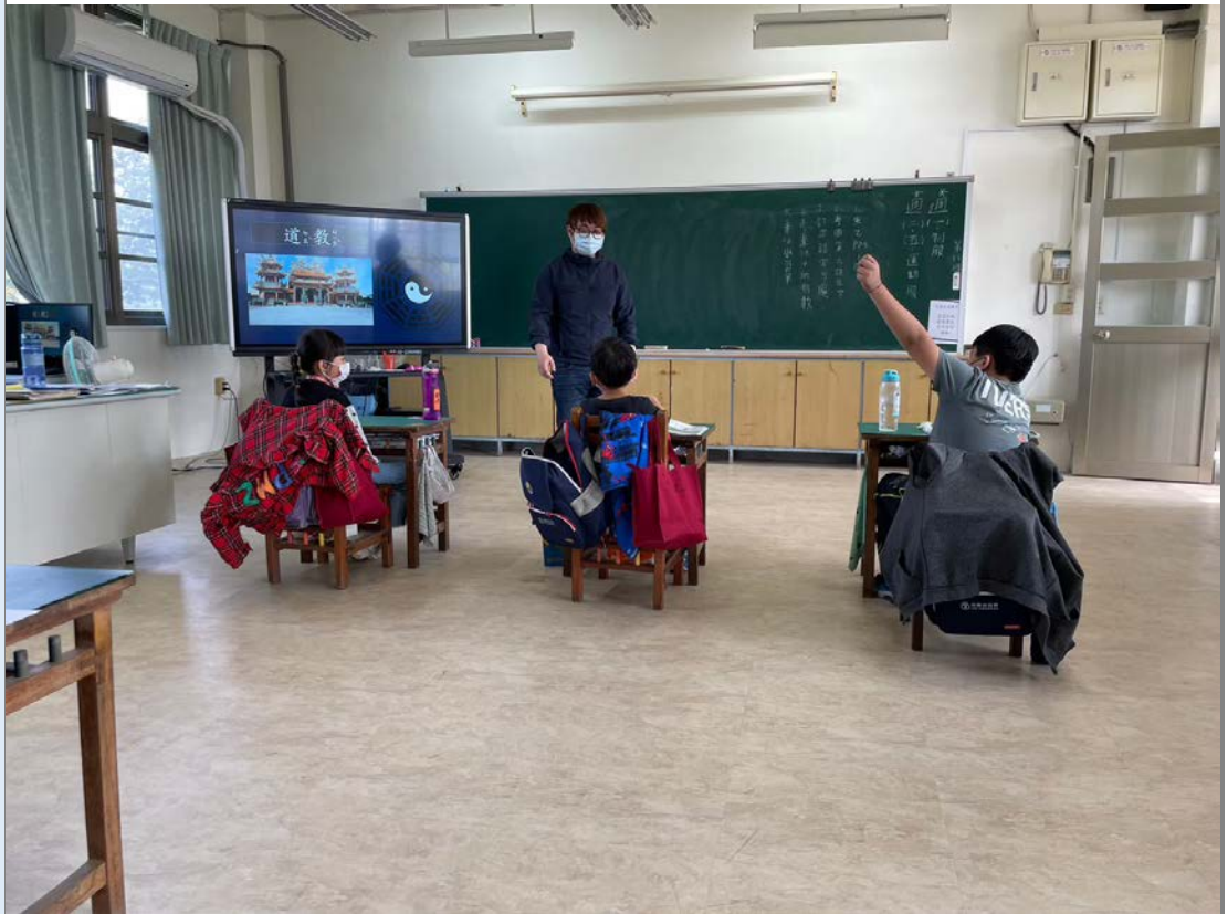
照片二:小朋友回答廟宇建築與一般建築有那裡不一樣?