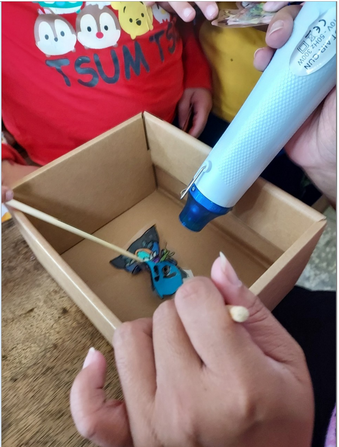
照片七：使用熱縮片製作吊飾時，熱風槍的操作過程。