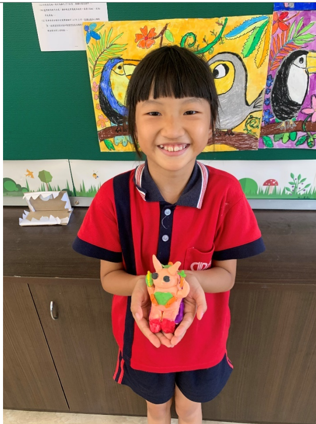
照片九:小朋友展示神農大帝黏土人的成品。