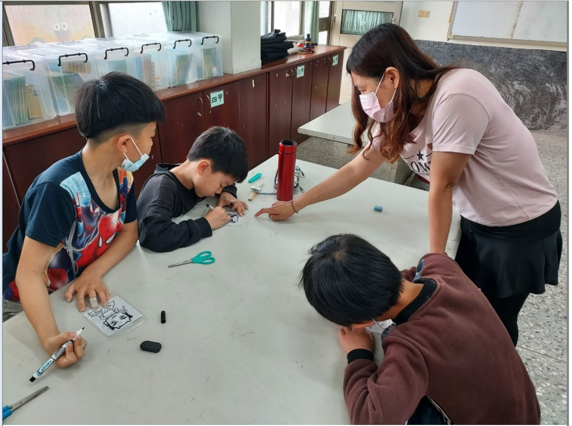
照片六：教師對小朋友的作品進行指導與協助。