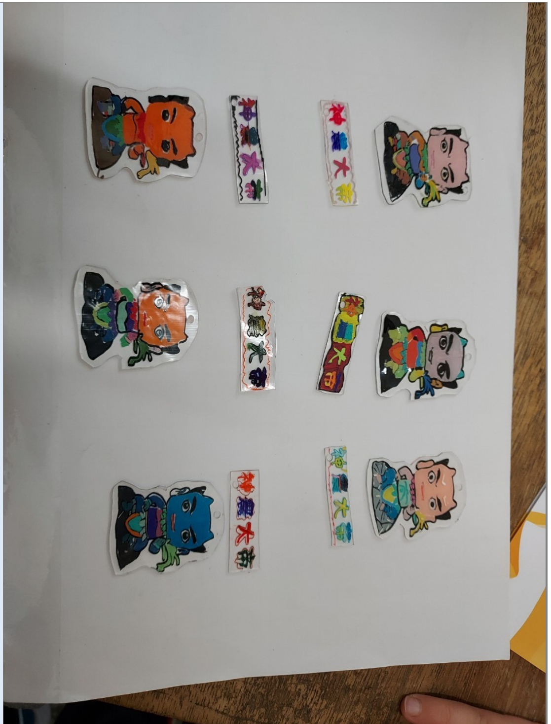
照片八：熱縮片使用熱風槍後的吊飾成品。