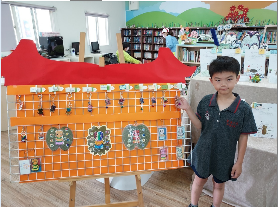
照片十:102年校慶時,小朋友為作品進行導覽。(圖為吊飾與書籤的成品)