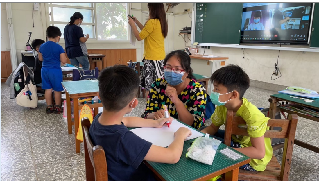
照片四：教師協助小朋友分組討論活動。