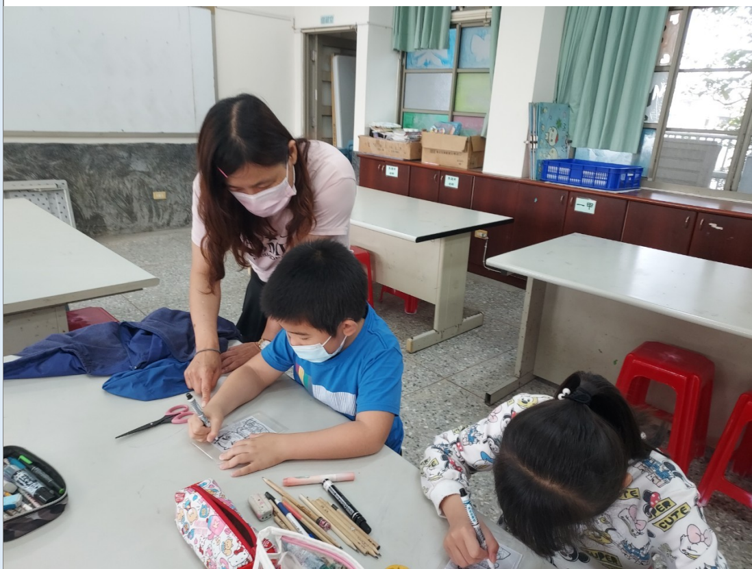
照片五：教師對小朋友的作品進行指導。