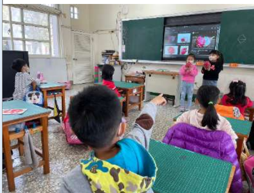
說明：進行實物實際觀察。