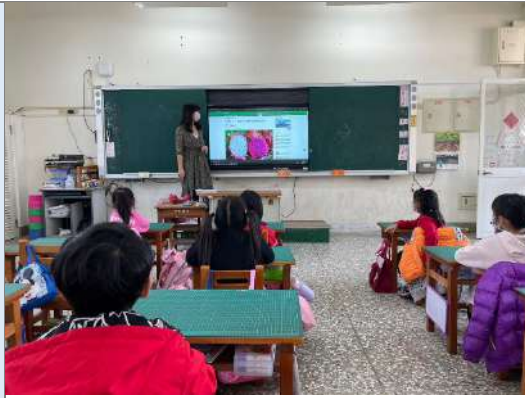
說明：介紹火龍果和香瓜