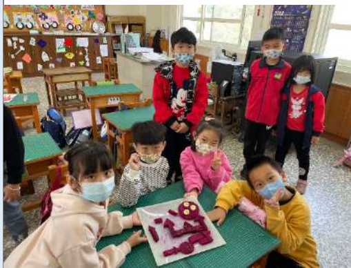
說明：製作水果拼盤