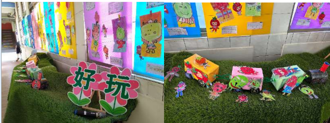
說明：配合校慶活動佈展，學生作品的呈現。