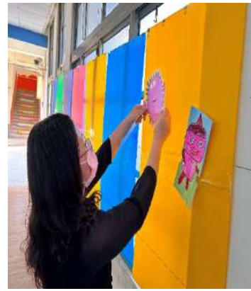
說明：配合校慶活動，學生作品佈展。