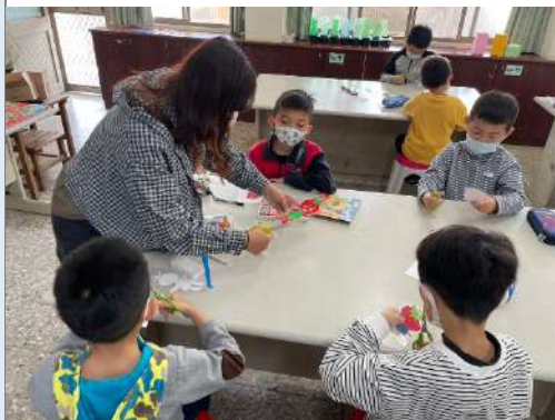
說明：教師協同教學-製作水果超人列車。