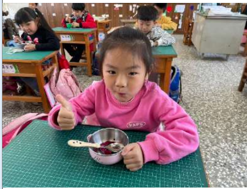
說明：品嚐美味水果