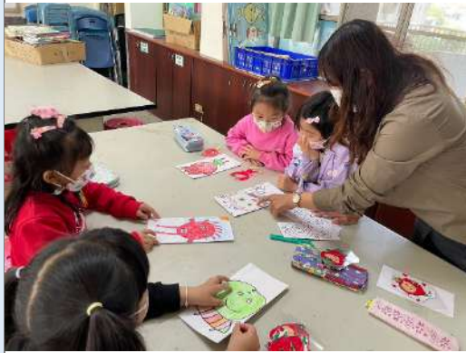
說明：製作水果手偶