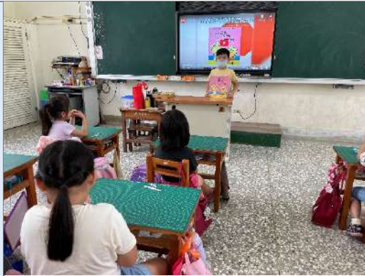
說明：繪本故事〈我絕對絕對不吃番茄〉