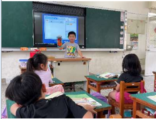
說明：上台發表-手偶介紹