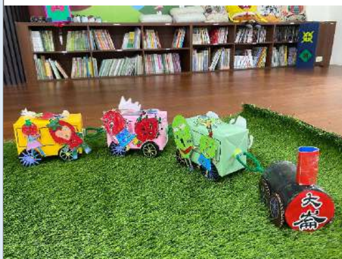
說明：教師協同教學-水果超人列車作品。