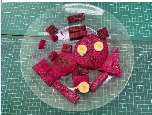
說明：水果拼盤小組成果