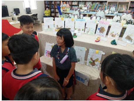
小小解說員，介紹校園植物