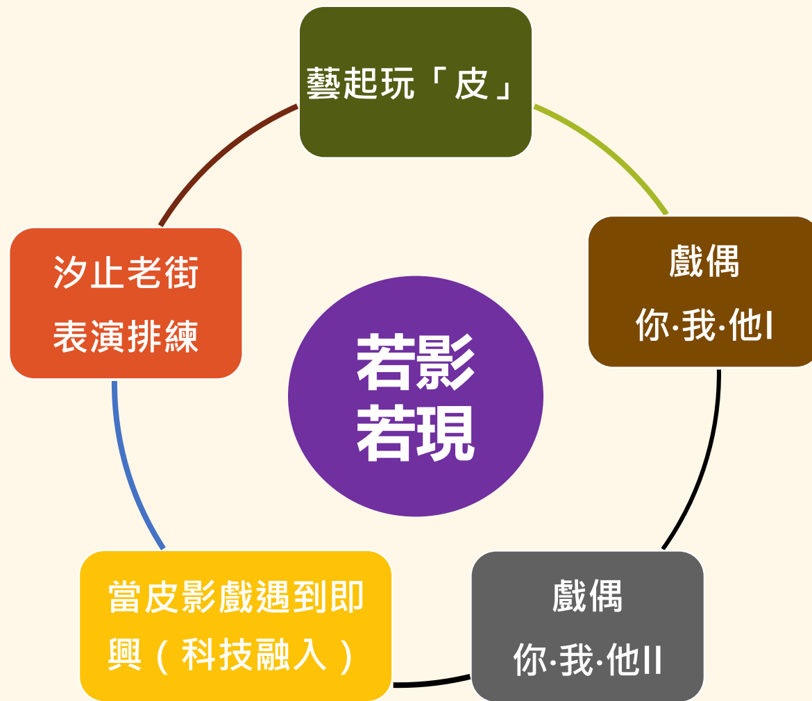
111-1課程「若影若現—當皮影戲遇上科技」課程架構圖