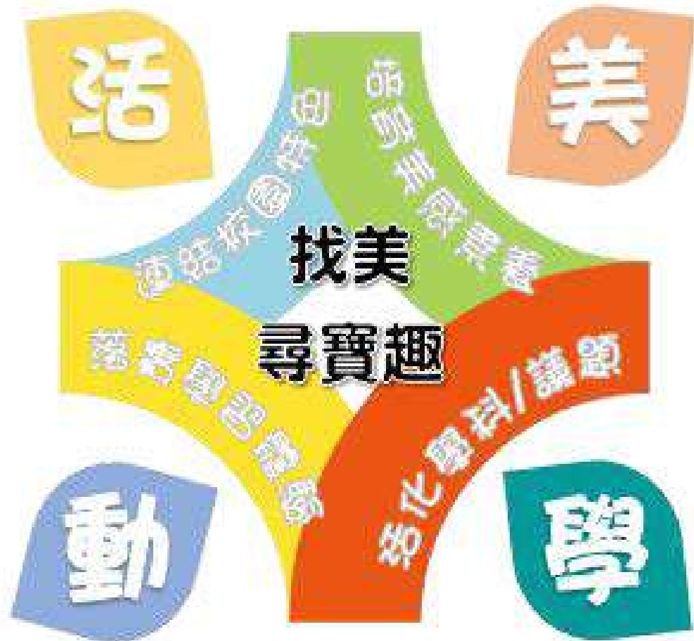
110-2課程「找美·尋寶趣」課程架構圖