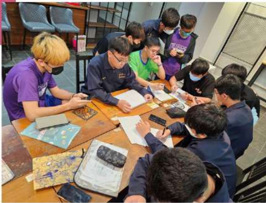
學生繪圖與排版·寫詩