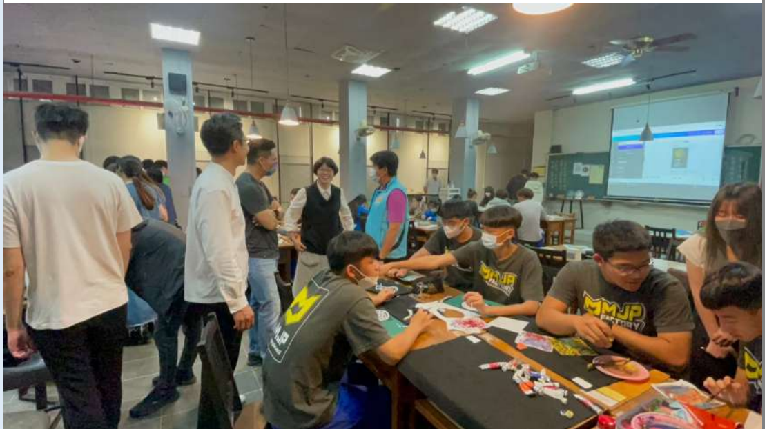
5. 中學生報 5/29 出刊報導。