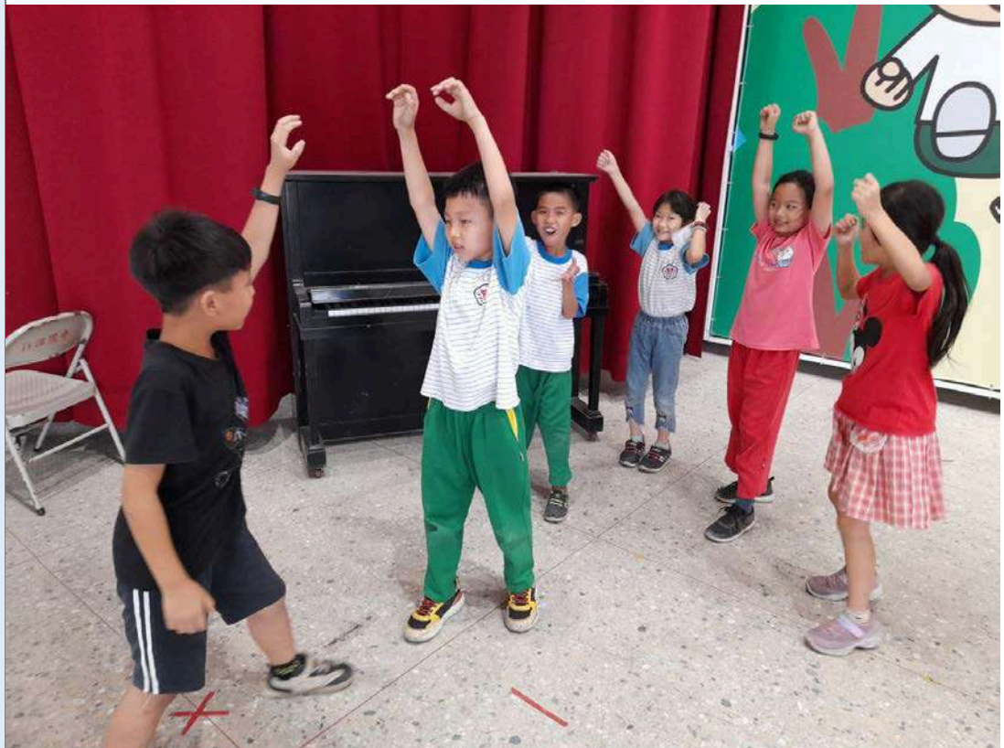
▲表演課時靜止雕像活動，表演在印度紫檀旁的球場打籃球。