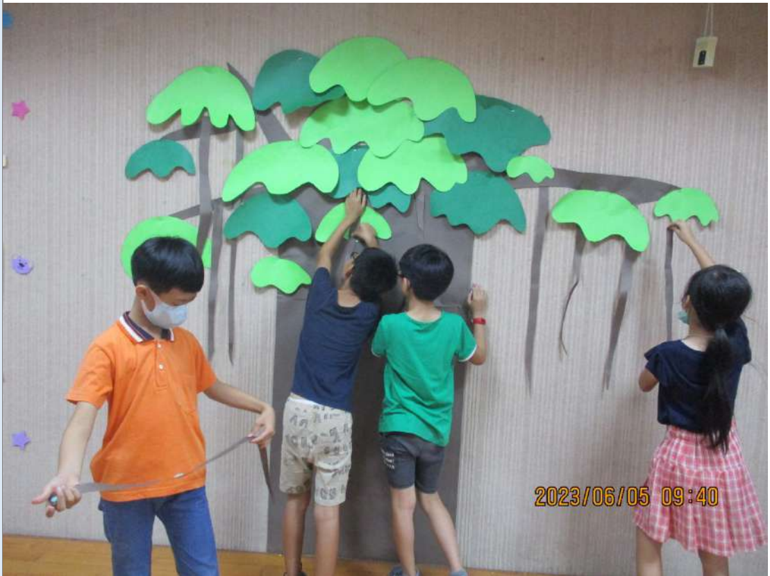
▲美術課時布置場景、製作道具。