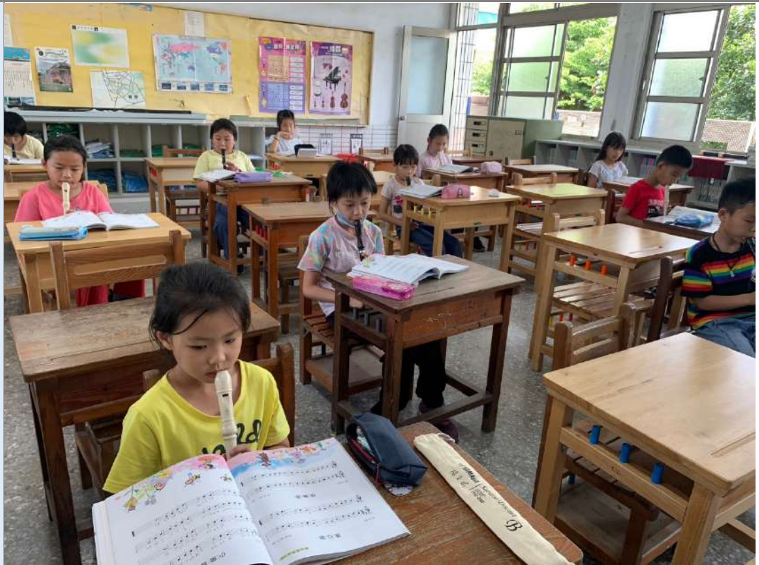
▲音樂課時，練習使用直笛吹奏小蜜蜂。