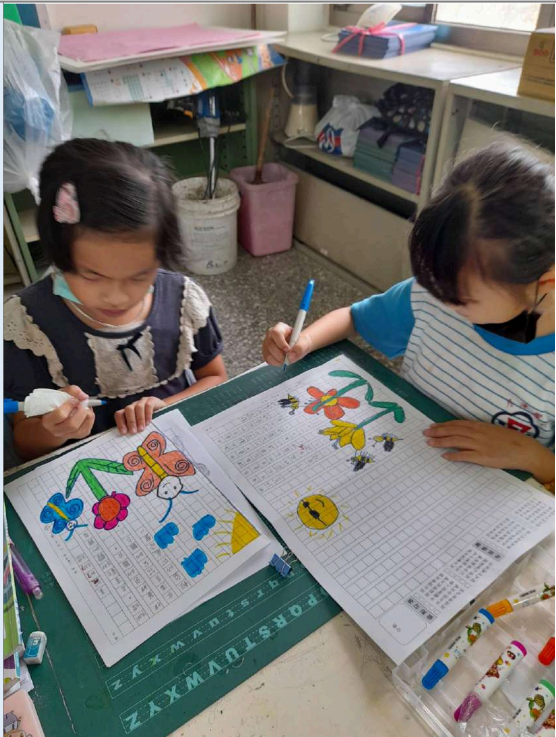
▲語文課時寫下校園生態的新詩，並畫上插圖。