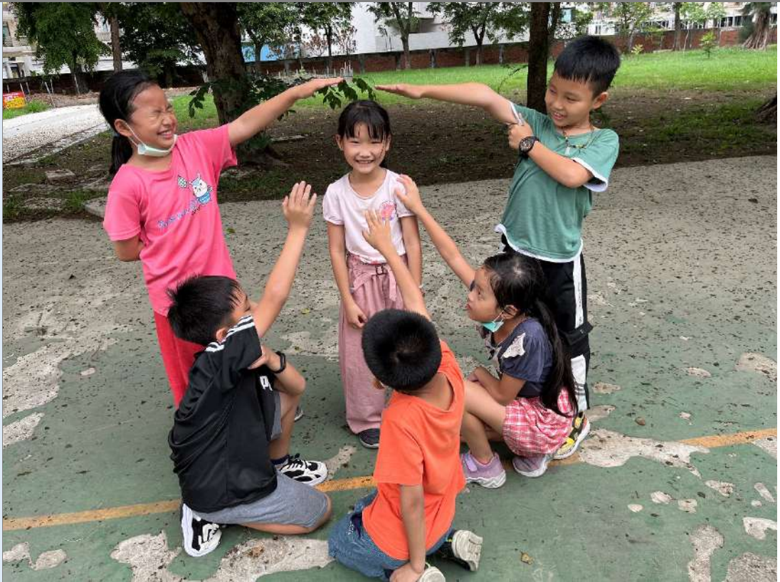
▲利用午休時間到印度紫檀旁的球場排練，感受真實場景有什麼不同。