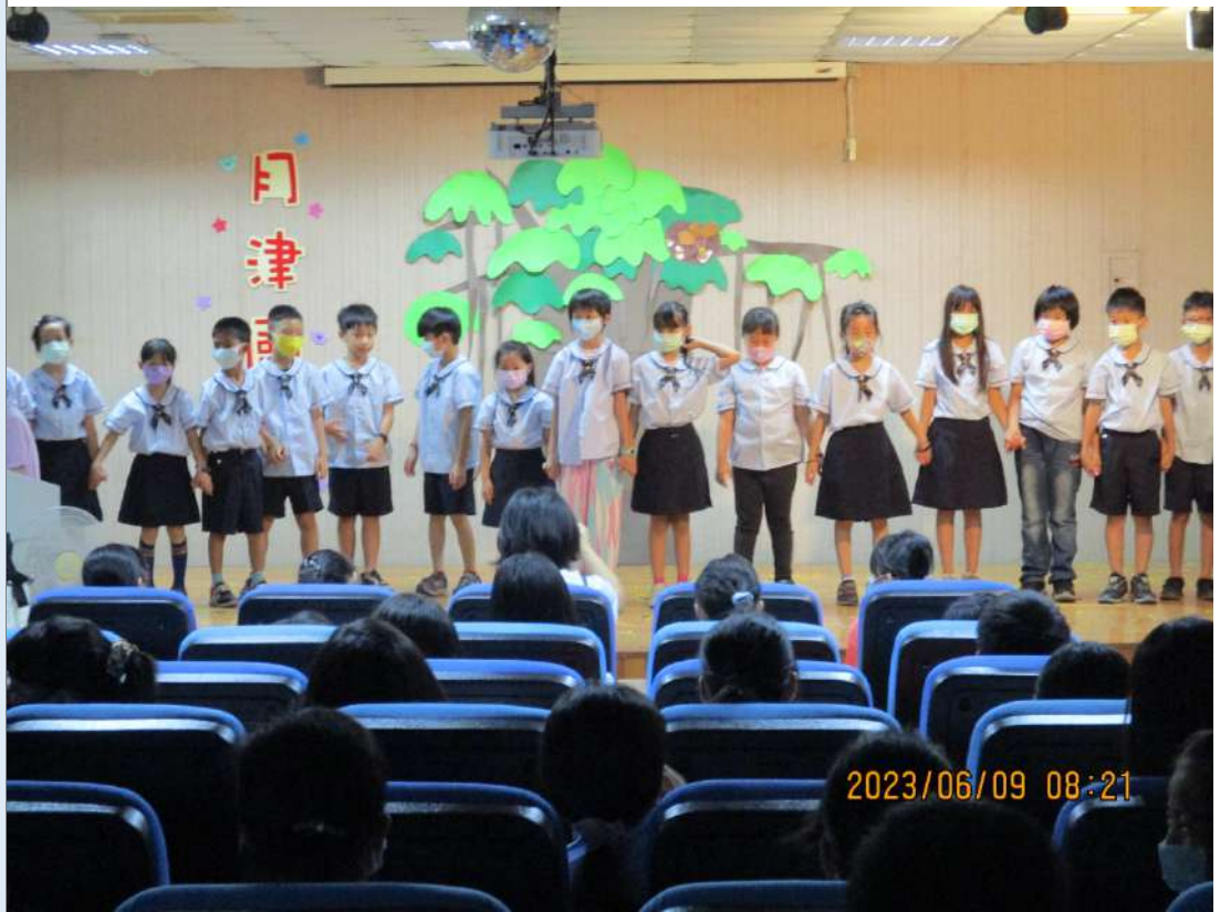
▲正式演出給校內的學欣賞，大家牽手憶起謝謝觀眾。