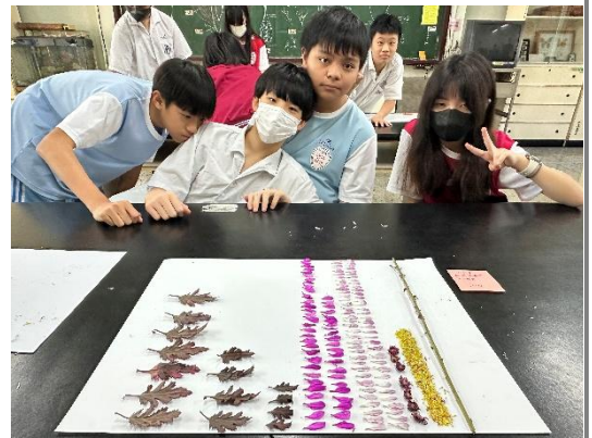
完成排列整理後開心合照