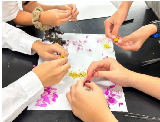
學生依花朵構造拆解