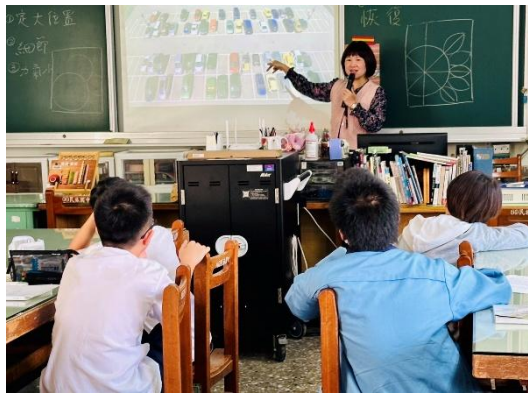
教師介紹整理藝術