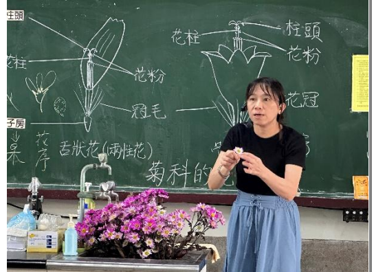
教師介紹認識花朵(菊科)的構造與其型態。