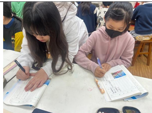
學生練習使用譬喻及四字語詞來完成公共藝術小日記。