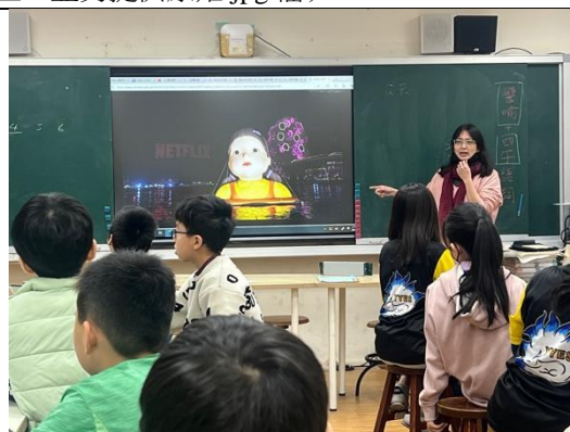
老師解釋如何使用譬喻及四字語詞來描述公共藝術作品。