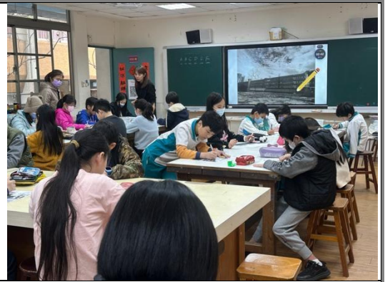
學生進行公共藝術設計發想階段。