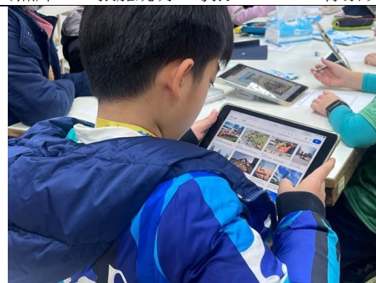
學生使用平板尋找自己感興趣的公共藝術作品。