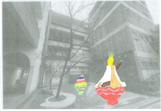
雙永公共藝術設計發想的作品。