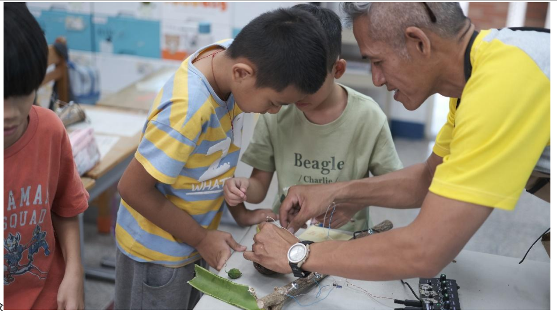
聲音蒐集與體驗 用巧克力泥漿作畫