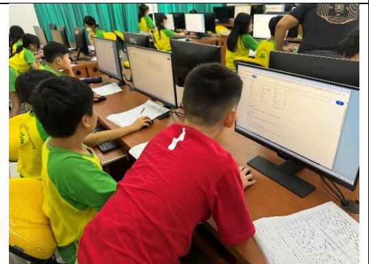
G5 同學認真的查詢南島語族相關語詞

相片原始檔連結： https://drive.google.com/drive/folders/1-h2GsGYCmVk2RKMa5RPFuASeBp6s9Q1j