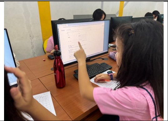
G6 同學認真運用 google translate 查詢菲律賓語、印尼語、大溪地語等語詞