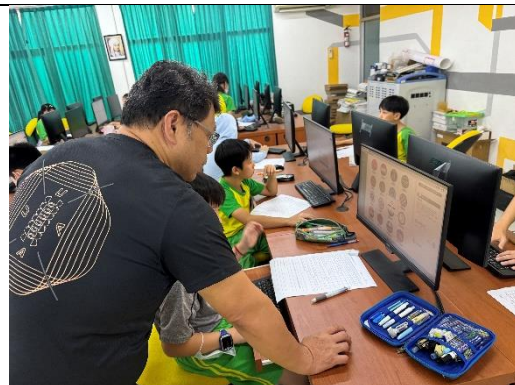
教師指導 G5B 同學使用臺灣原住民族語詞典網站查詢語詞