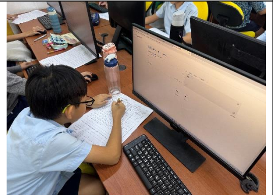
G6 同學認真的查詢南島語族相關語詞