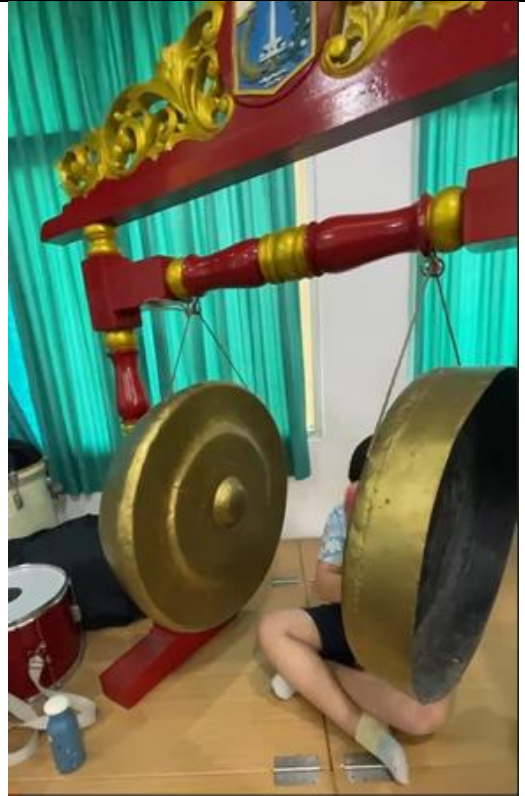
六年級同學練習實況。