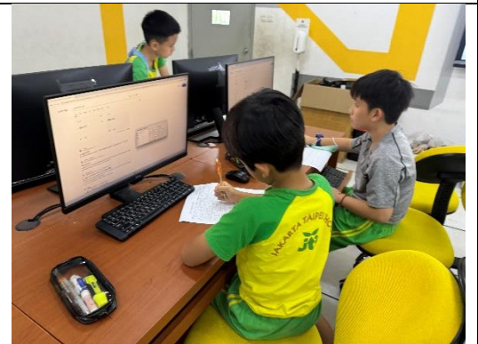
G5 同學認真運用 google translate 查詢菲律賓語、印尼語、大溪地語等語詞