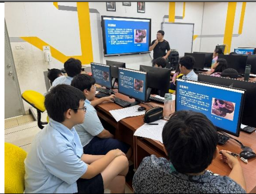
G6 教師為同學介紹印尼簡史及文化特點