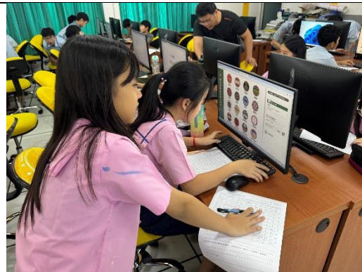
G6 同學認真運用線上臺灣原住民族語詞典查詢語詞，並與其他南島民族語言比較