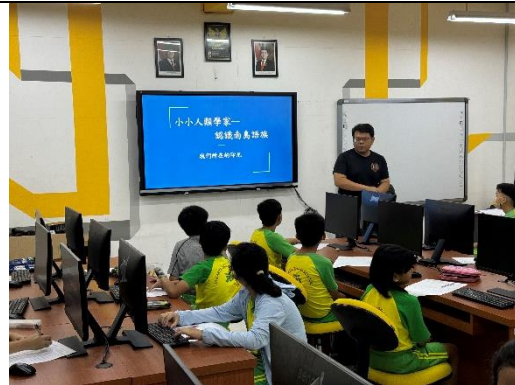
G5 同學認真聆聽教師課程介紹