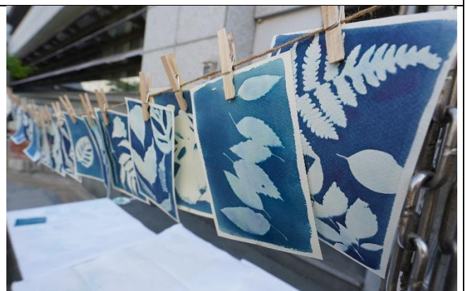
學生代表藍曬初體驗成果展示