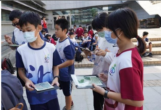
學生代表藍曬初體驗 4