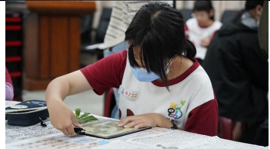
學生代表藍曬初體驗 3