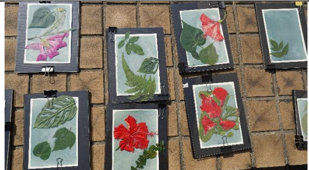
學生代表藍曬初體驗 5