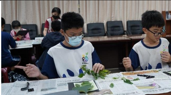
學生代表藍曬初體驗 2