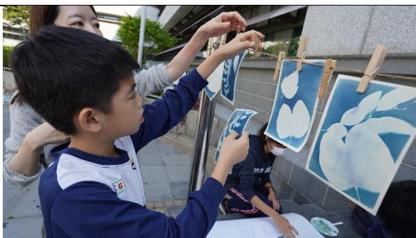
學生代表藍曬初體驗 6