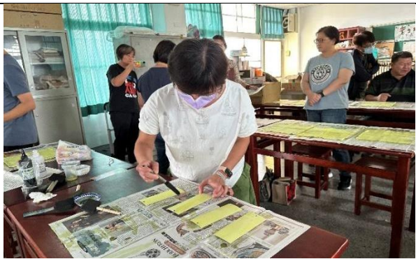
研習夥伴著手實作 2