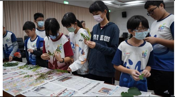
學生代表藍曬初體驗 1