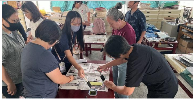
研習夥伴著手實作 1