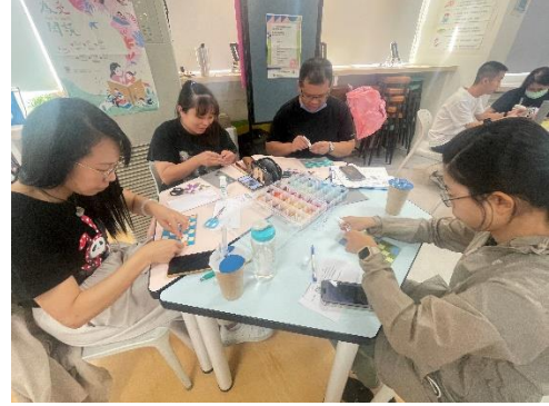
老師們實地操作顏色搭配