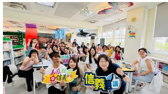
學思達與美感教育共融之增能研習