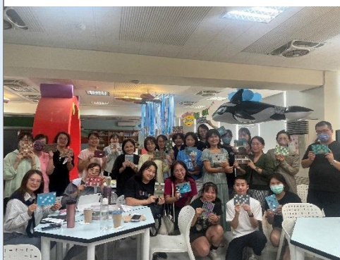
跨校、跨學習階段的增能研習