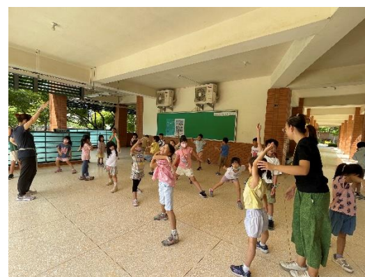
透過協同教學，老師們藉由學生課堂，觀課教學法式