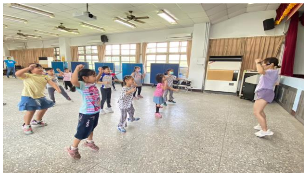
肢體伸展課程—舞蹈指導