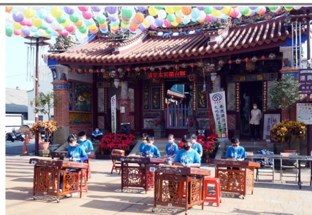
學生參加竹山連興宮新年書法活動開場表演