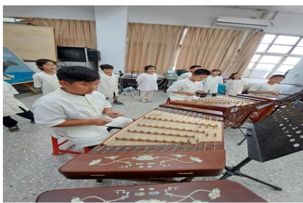
築夢小學堂到校迎賓表演