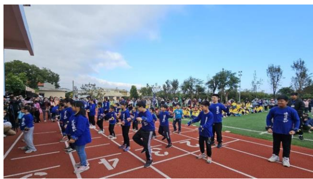
肢體伸展課程—七校聯運舞蹈表演