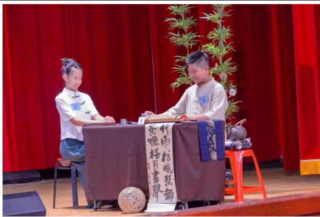
茶業博覽會小小泡茶師比賽