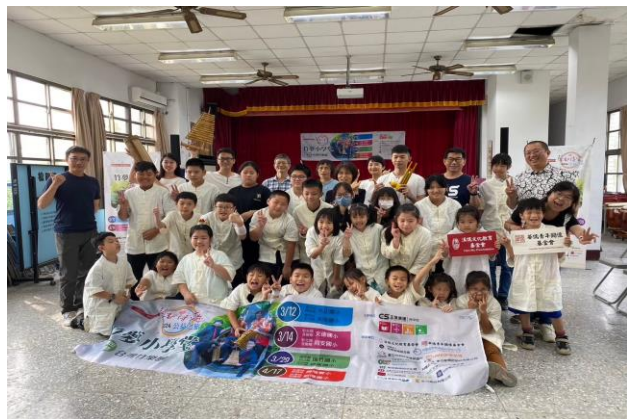
築夢小學堂到校合影