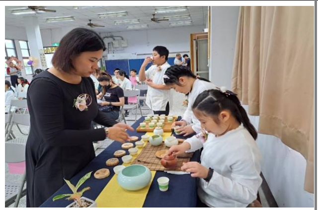
本校會長交接學生擔任接待---泡茶