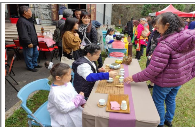
學生支援大鞍獅子會茶會活動